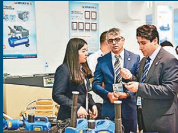
■內地出口企業憂海外採購商減少到港落單。 本報廣州傳真

如以往，廣交會的秋交會在10月15日舉行，而香港電子展則在10月14至16日舉行，展期與廣交會一期有些重疊。有電子電氣出口企業表示，因為有香港電子展的舉行，使廣交會頭天海外採購商相對較少，然而17日後，廣交會一期海外採購商數量有所增加，參加完香港電子展的海外採購商趕往廣州參加廣交會。之前，有企業採取兩條腿走路的方式兩邊參展，希望爭取更多訂單，「不過，今年有出口企業放棄了去香港參展，估計是擔心效果不理想」。