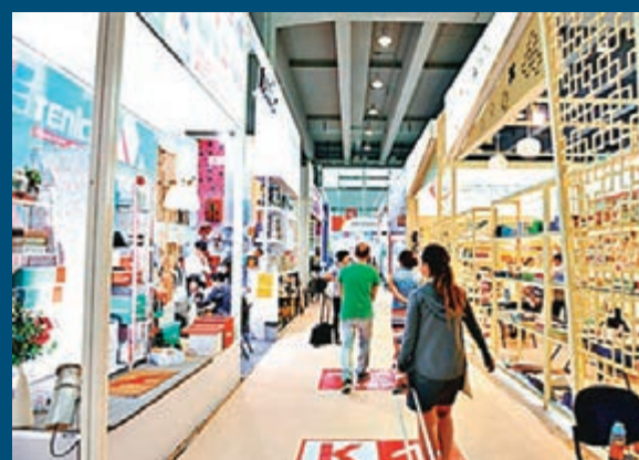
■有出口企業指，雖然港參展費用比廣交會低，但擔心「佔中」影響採購商來港。 本報廣州傳真