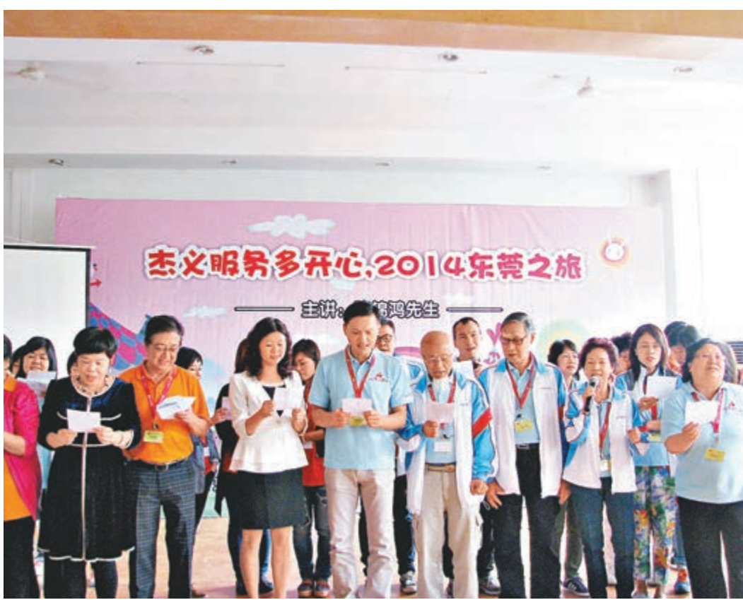
■香港影星陳錦鴻與自閉症兒童家長合照。

陳錦鴻告訴記者，對待自閉症兒童，家長首先要接受，其次要正視，這是最重要的。應記者要求，陳錦鴻為內地自閉症兒童父母留言「正視」這兩個字，呼籲家長們接受並耐心對待。他還將自己寫的書《我和兒子的每一步》送給現場家長，也建議香港、台灣的相关服務機構能多到內地交流，共同探討解決這一難題。