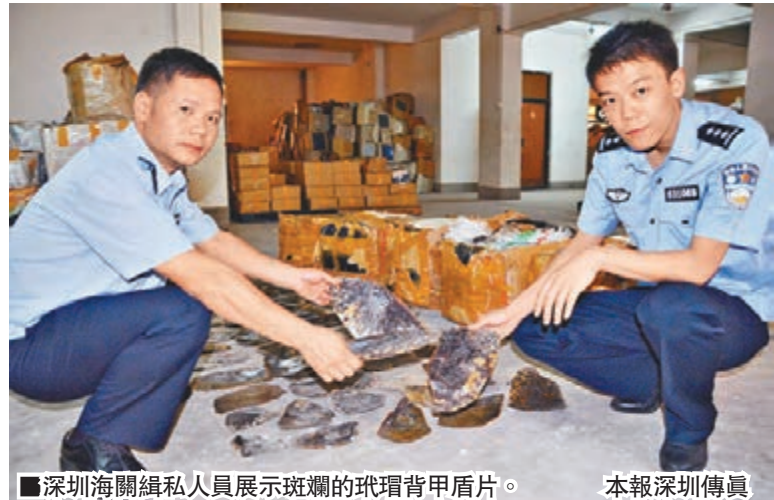
■深圳海關緝私人員展示斑斕的玳瑁背甲盾片。

香港文匯報訊（記者 李薇 深圳報導）深圳海關近日查獲一宗大型珍稀動物外殼走私案，經專業部門鑒定，查獲的5,312片龜殼全部為國家二級重點保護動物玳瑁的背甲盾片，涉及玳瑁親體共408隻，僅查獲龜殼就重達105公斤。目前，4名涉案人員被刑事拘留，可能面臨至少10年以上的刑罰。