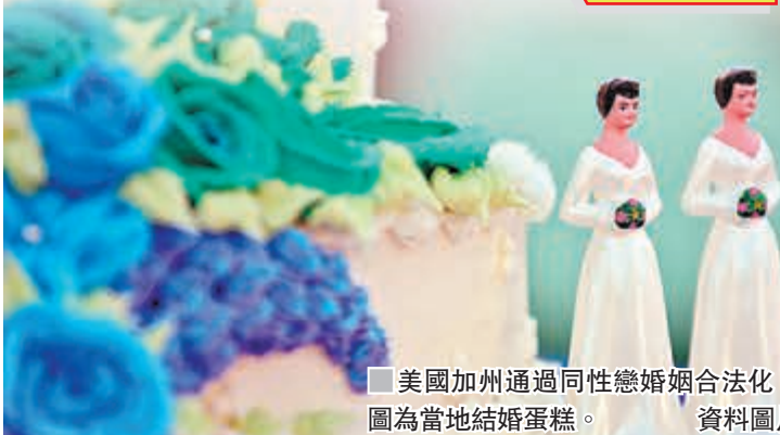
■美國加州通過同性戀婚姻合法化。圖為當地結婚蛋糕。