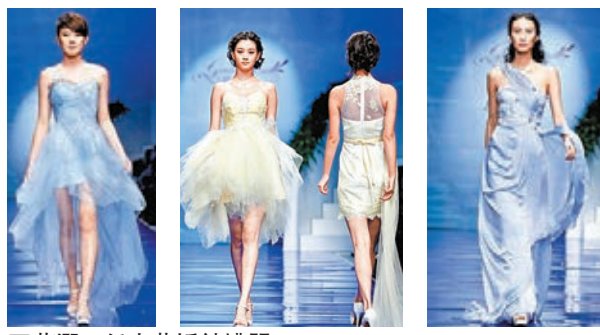
葛瀾·任春華婚紗禮服

當然，除了內地的設計師，香港亦有設計師參加，在時裝周上，模特兒在「旭化成·中國時裝設計師創意大獎—劉夢曦作品發佈會」上便展示了香港時裝設計師劉夢曦的作品。