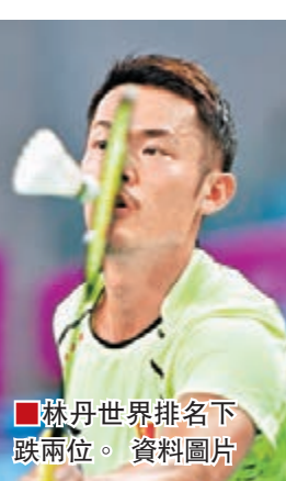
林丹世界排名下跌兩位。

世界羽聯 30 日公布了最新一期的世界排名。男單方面, 男單方面, 大馬「一哥」李宗偉仍居榜首, 領先第二名、中國新銳諶龍近 1 萬分; 大滿貫球手林丹下降 2 位, 排名第 14。女單方面, 中國金花李雪芮、王適嫻、王儀涵佔據三甲。男雙方面, 韓國強檔李龍大/柳延星仍然排名榜首, 日本女雙組合松友美佐紀/高橋禮亞, 中國的張楠/趙芸蕾和徐晨/馬晉繼續佔據混雙前兩位。 ■香港文匯報記者 陳曉莉