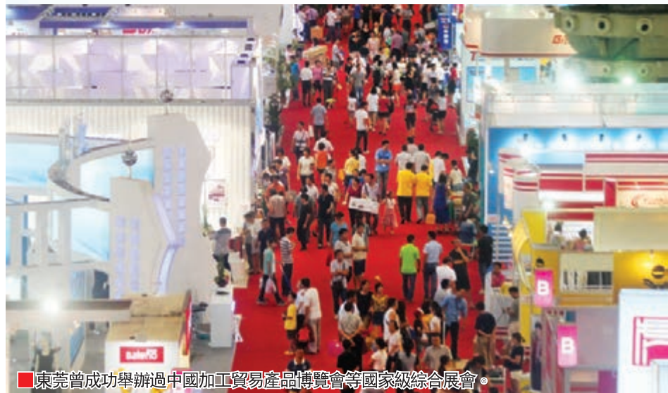
東莞曾成功舉辦過中國加工貿易產品博覽會等國家級綜合展會。