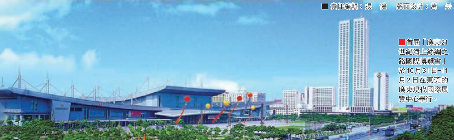
首屆「廣東21世紀海上絲綢之路國際博覽會」於10月31日-11月2日在東莞的廣東現代國際展覽中心舉行。