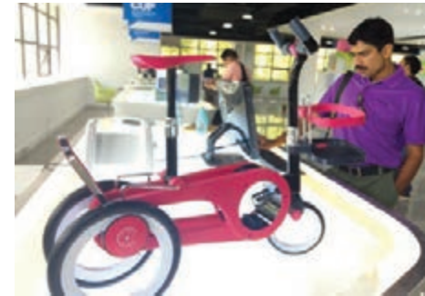
海上絲綢之路沿岸國家主流媒體參觀東莞企業。