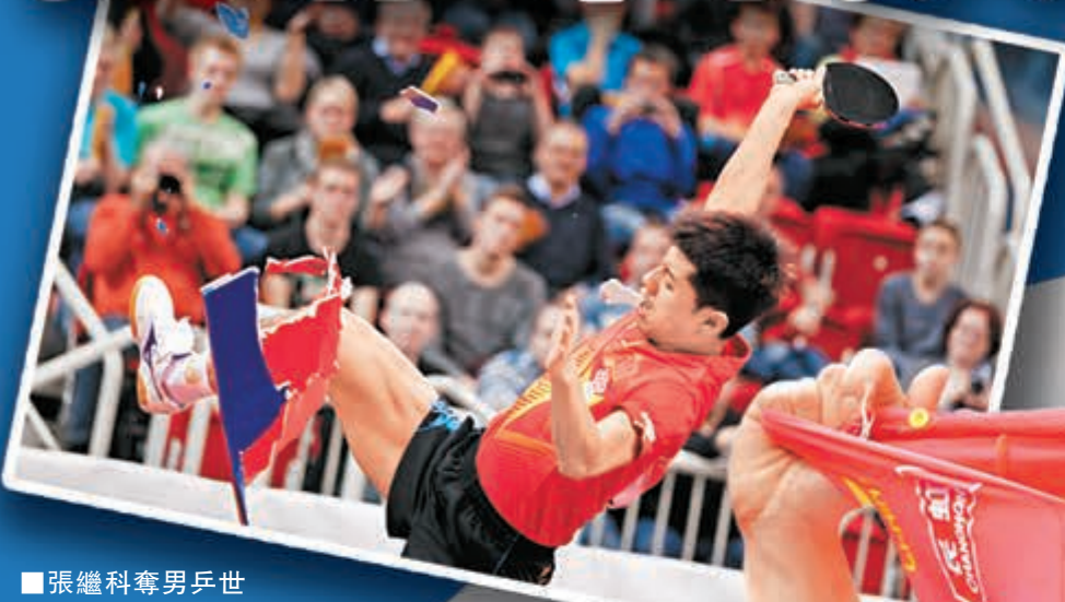
張繼科奪男乒世盃冠軍後踢壞廣告牌。

雖然男乒世界盃已於周日落幕，奪冠後瘋狂慶祝的中國球手張繼科踢壞廣告牌被罰一事也隨之成為過去，但樹欲靜而風不息，新華社旗下新華視點微博29日對事件作出評論，指責張繼科損毀國家形象，讓祖國蒙羞。