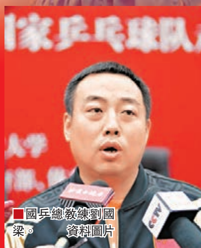
國乒總教練劉國梁。 資料圖片