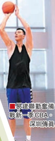
易建聯聯動奮戰新一季CBA。