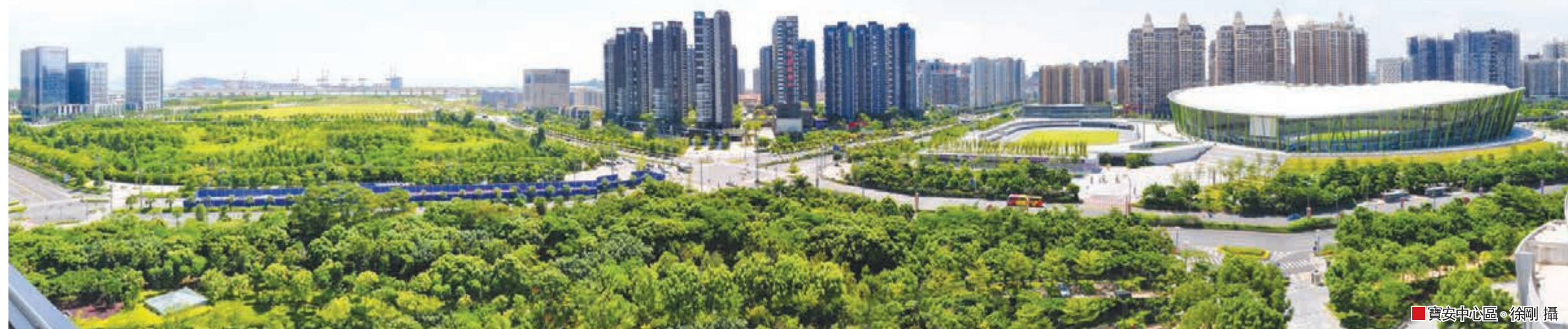
■ 寶安中心區。