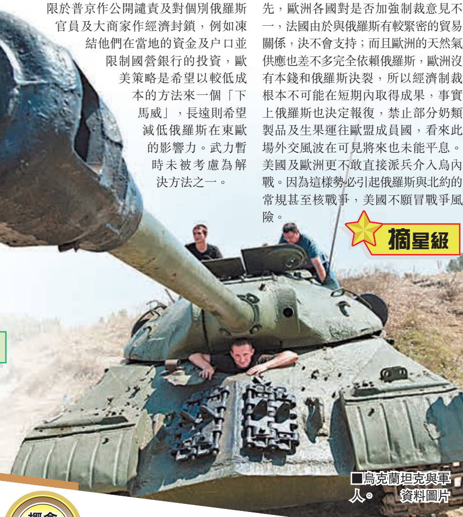
烏克蘭坦克與軍人。資料圖片