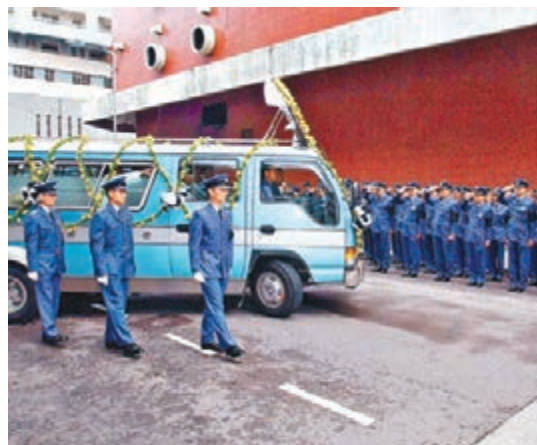
兩名殉職隊員當年獲最高榮譽儀式舉殯,並安葬浩園。