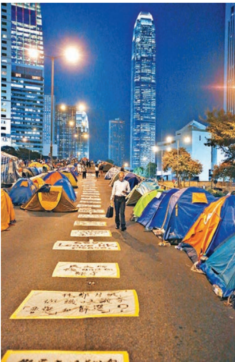
「佔領」者喜歡到處塗鴉。圖為昨日「佔領」區情況。

根據刑事罪行條例第二百零六條「推毀或損壞財產」,任何人無合法辯解推毀或損壞他人財產,即屬犯罪,刑罰會視乎被損毀物件的價值,以及能否復原而定,最高刑罰為判監10年。