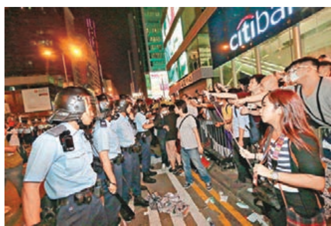
政界人士指,警方清場似是唯一辦法。圖為「佔領」者挑釁警員。

他並提醒,在「佔領」區內工作的人及居民要提高警覺,小心防火,又提供多項建議,如煮食爐附近不要放置易燃物品,小心處理火種,如火柴、香煙、香燭等,熟悉樓宇內的求生通道及消防設備等。而前日的港九「佔領」地區樓宇內,火警召喚達標率達100%。