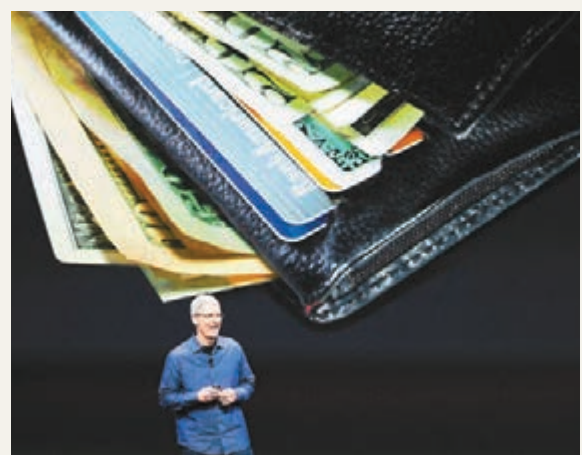
庫克指，Apple Pay 在上線3天之內，已有逾百萬用戶開始使用。