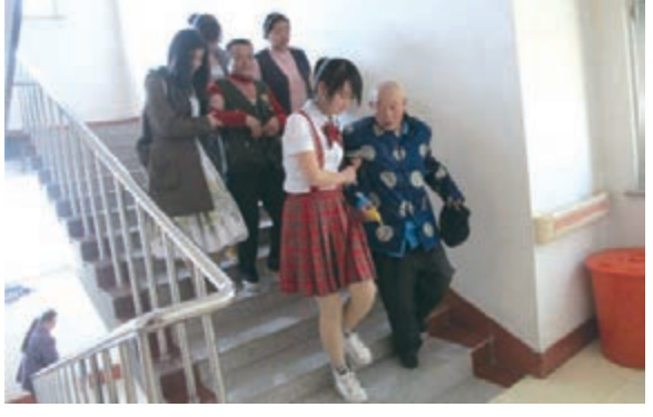
■吉林大學護理學院學生為長春市社會福利院老人服務。

吉林省服務業仍以傳統服務業為主,佔比高達64%。製造業和服務業融合發展不足,生產性服務業