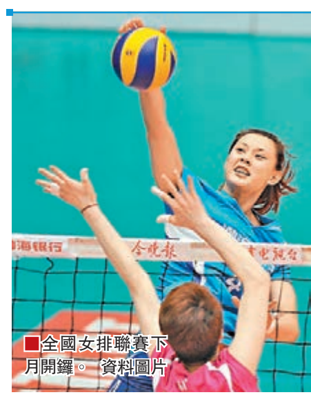
全國女排聯賽下月開鑼。 資料圖片

2014年國際桌球錦標賽(國錦賽)27日在成都展開第二日角逐。在外卡輪比賽上演大逆轉的中國神奇小子趙心童手感依然，單杆轟出了139的高分，以6：3輕鬆挑落馬福林，晉級第二輪。17歲的趙心童是此次比賽年齡最小的選手，他表示：「今天狀態比較好，加上上手比較快，而對方一開始還未進入狀態，讓我大比分領先，後面139分是狀態好的原因，很快拿下了比賽。」由於丁俊暉在資格賽過早出局，外界將中國隊的大旗放在趙心童身上。 ■新華社