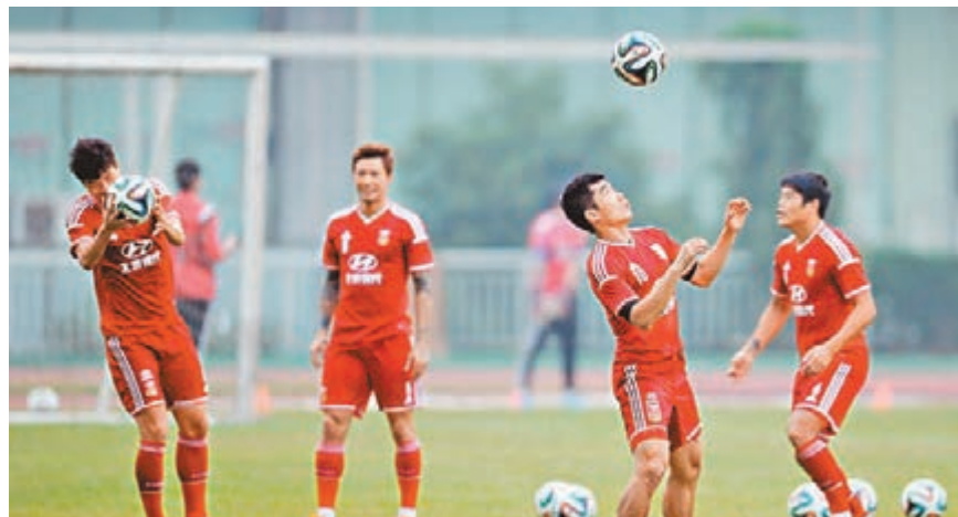
國足下月中將迎戰新西蘭，為亞洲盃熱身。 資料圖片

戚軍說，「雖然南昌是第一次承辦中國國家足球隊的比賽，但南昌作為中國革命的紅色聖地，南昌相關俱樂部參加職業聯賽期間主場比賽時的球迷也是擁有萬分的热情，相信國家隊在南昌球迷热情的支持和助威下，為大家奉獻出精彩的比賽。」 ■香港文匯報記者 梁啟剛