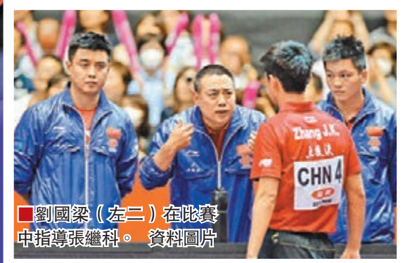
劉國梁(左二)在比賽中指導張繼科。 資料圖片

張繼科經過7局激戰，以4：3逆轉隊友馬龍，奪得個人第2個世界盃冠軍。壓抑了許久的張繼科賽後瘋狂慶祝，踢壞了兩塊廣告牌。這種行為引起了軒然大波，國乒總教練劉國梁賽後對他進行了嚴厲的批評。劉國梁在接受狐搜體育訪問時表示：「繼科今天的行為讓我非常震驚，作為總教練我覺得我是有責任的，在對隊員的教育方面做得還不夠。繼科是一個非常有激情的運動員，表達的方式每次都有一些過。但是以往沒有這麼過分。所以說今天不管他有甚麼樣的原因，這都是一個非常錯誤的行為，不管是對張繼科本人還是對全隊，都應該敲一個警鐘。」劉國梁代張繼科道歉：「我們要認真做出總結作出檢討，不管我還是張繼科本人。作為隊伍的總教練，我代表張繼科向所有觀看比賽的球迷和現場觀眾以及贊助商、廣大球迷道歉，我們一定會讓繼科改正這方面的毛病。」劉國梁希望張繼科通過此事走向成熟，「不管你是一個多麼優秀的運動員，首先你是個好人，做一個有價值的人。他有那麼多的粉絲，其實不是說叛逆就是一種影響力。最後我們希望這件事能夠讓他的人格魅力有一個重大的轉變。」 ■香港文匯報記者 陳曉莉