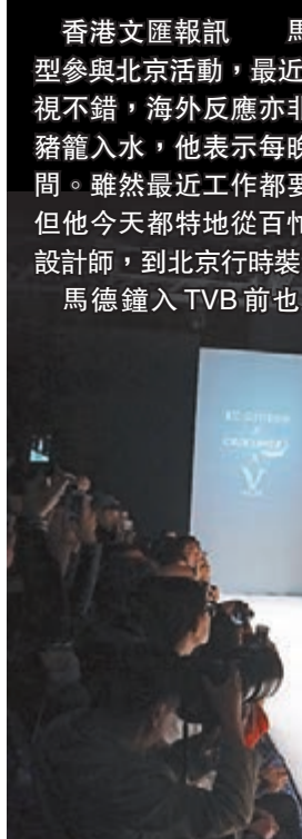
馬德鐘表示行show重拾當年的感覺。

香港文匯報訊 馬德鐘昨日以飛虎造型參與北京活動，最近熱播的《飛虎II》收視不錯，海外反應亦非常好，馬德鐘可謂豬籠入水，他表示每晚只得兩小時睡眠時間。雖然最近工作都要四圍走比較辛苦，但他今天特地從百忙之中抽空支持香港設計師，到北京行時裝show。馬德鐘入TVB前也當過模特兒，而太太也是著名模特兒，對於今次能讓他重操故業感到非常開心！他表示：「好耐無正式行過fashion show，都有啲緊張但好開心！見到香港設計師的作品設計非常成熟，好開心可出席今次活動支持他們。」他笑說行show重拾當年的感覺，非常滿意自己剛才的表現，只是要穿着短褲比較凍。