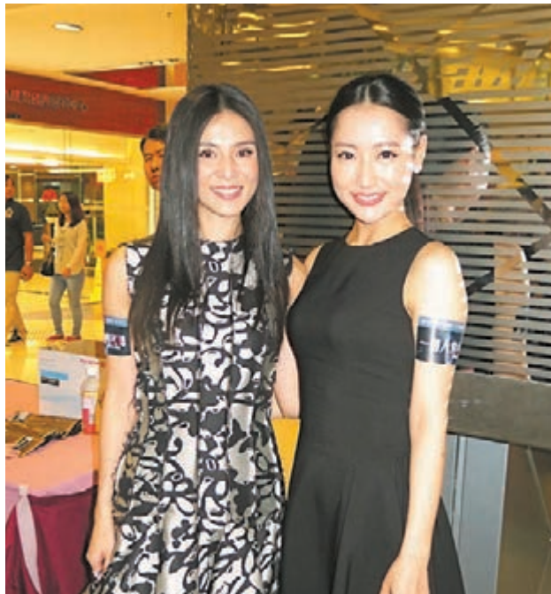
楊采妮和白冰因拍戲成為好友。