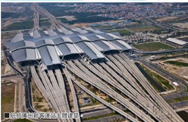
航拍廣州新客運站主體建築。