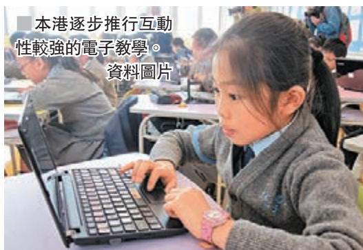
本港逐步推行互動性較強的電子教學。 資料圖片