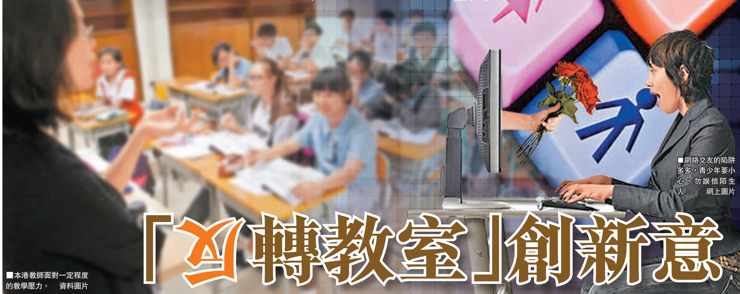
■網絡交友的陷阱多多，青少年要小心，勿誤信陌生人。