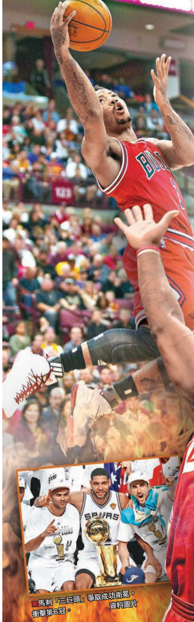
羅斯復出是公牛一大喜訊。