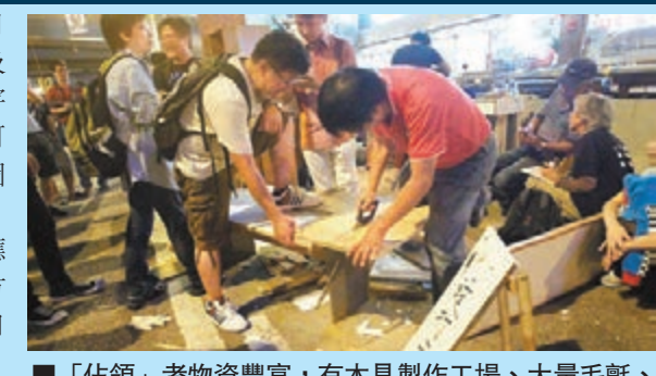
「佔領」者物資豐富,有木製製作工場、大量毛氈、地氈、晾衫架、帳篷、膠墊等。

香港文匯報訊(記者 文森)「佔中」示威者連日「佔領」港九各區多條道路,位於銅鑼灣堅拿道西及禮頓道交界的交通燈,昨晨發現被貼上雨傘圖案及字樣。警方表示,該段道路為繁忙路段,駕駛人士有可能因而被誤導或注意力被分散而發生意外,批評貼圖及字的人為達到目的罔顧公共安全,對此予以譴責。警方又指,「佔領」者物資豐富,可謂「生活所需應有盡有」,反映他們已為長期「佔領」作準備。警方再呼籲,示威者盡快移除障礙物並撤離,以免危害自身及公眾安全。