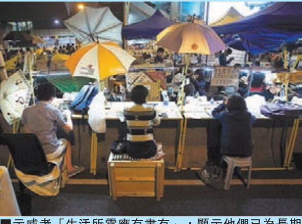
示威者「生活所需應有盡有」,顯示他們已為長期「佔領」作準備。

警察公共關係科總警司許鎮德指出,發現旺角有示威者以卡板、鐵馬、鐵鍊、膠索組成障礙物,令公共安全风险越來越高。位於彌敦道近登打士街的一個障礙物