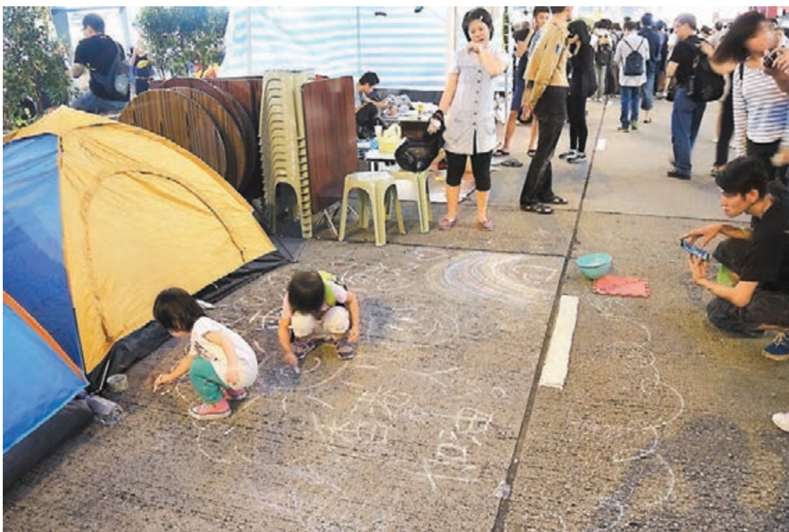
有示威者指旺角「佔領區」是「景點」、「家庭樂的好地方」,更帶同子女在街道上塗鴉。

本報記者昨日親身到旺角「佔領區」,沿途發現多張鼓吹激進思想、仇視警方的傳單和海報。有海報指,「勿忘初『衝』,如果唔係當初有人衝,我哋點會有得坐喺度?」有海報呼籲「戰鬥到底」;另有海報醜化警員為「古惑仔」。記者又發現,有「佔旺」示威者並非為了「爭取普選」而來,有示威者只是要求「梁振英下台」,亦有示威者要求港府收回單程證審批權等;更有甚者,有示威者