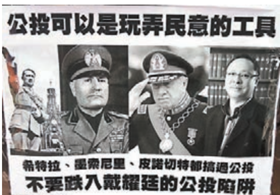
旺角「佔領區」近日充斥反對所謂「廣場投票」、批評「佔中三丑」的海報。