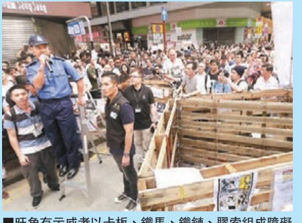
旺角有示威者以卡板、鐵馬、鐵鍊、膠索組成障礙物,令危害公共安全的風險越來越高。

他說,旺角屬高危地區,隨時發生一觸即發的大型衝突,當有人受傷需要救護時,可能會因為障礙物妨礙救護車到場。他期望示威者盡快移除障礙物,以免危害自身及公眾安全。對於有報章指,示威者計劃把「佔領」行動持續至明年,許鎮德說,警方會因應實