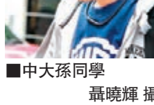
■中大孫同學 攝曉輝攝

就讀於中文大學工程系的孫同學表示，「佔中」未開始前，他對是否透過違法「佔領」行動爭取民主支持中態度，但認為事件已搞得愈來愈大，「有啲過咗火」。他認為，「佔中」行動已影響了香港的形象，更被國際社會「火」，其實是在破壞香港。孫同學又嘆嘆事件不知如何完結，「示威者會以為為難，結束行動就等於認輸，所以就算連學聯聯名叫唔啱班學生。」他又表示，身邊不少同學都十分激進，很少反對「佔中」，但尚幸彼此之間可以溝通，沒有「被絕交」。