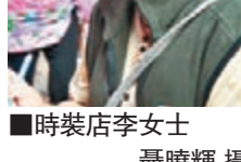
■時裝店李女士

在銅鑼灣經營時裝店的李女士指出，自「佔中」開始後，生意額大跌一半，「爭取理想都要食飯！」她又認為，「佔中」發展至今，早該結束，批評示威者「識放唔識收，十分幼稚」。她相信，示威行動背後有個別人土一直「搞煽動」，只為了達到一己政治目的，批評他們「已經『擺爛』卻仍硬著全香港人的脖子不放」。