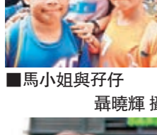
■馬小姐與仔仔

馬小姐表示，「佔中」行動造成的影響不僅是經濟與民生，更對市民的情緒造成影響。她認為，雖然不少學生都充滿激情、十分熱血，但必須明白到香港是實行「一國兩制」，港府或特首可以做的事情亦有限制。「我不覺得今次「佔領」行動可以成功爭取到甚麼，再這樣下去香港只會更趨分裂，其實我認為警方應該一早就清場。」她的一對9歲學生兒子亦表示，明白示威者是在爭取民主，但認為不應走到街上阻礙市民上班上學，他們的學校亦因此而曾停課4天。他們又為辛苦工作的警察「打氣」。