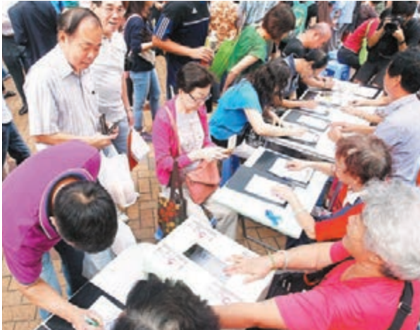
市民踴躍簽名，氣勢空前高漲。