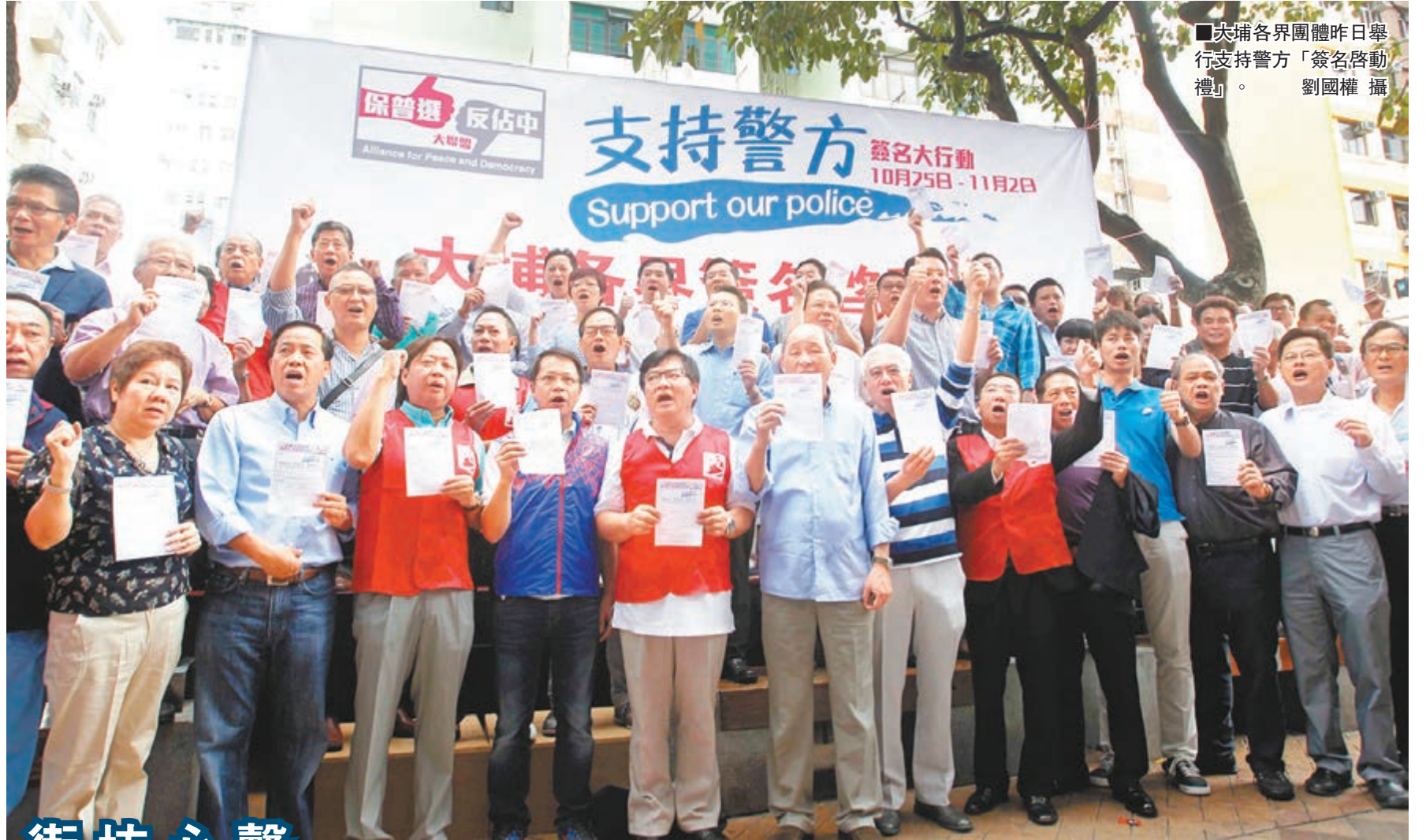
大埔各界團體昨日舉行支持警方「簽名啟動禮」。

大聯盟昨晚公布，昨日共設806個街站，共收集272,682個簽名，其中「紅表」簽名(即18歲以下人士)有1,523個，另外昨日截至晚上7時共收集58,461個網絡簽名，全日總計共收集331,143個簽名。大聯盟並公布，簽名行動首兩天共收集551,212個街站簽名(包括3,395個「紅表」簽名)，及101,758個網絡簽名(已剔除「惡搞」的472個)，兩天總計共收集652,970個簽名。單以是次簽名行動首兩天的街站簽名數目計算，已比上次「保和平 保普選 反暴力 反佔中」簽名行動錄得的379,367個更多。