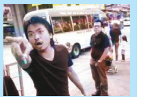
在大角咀工聯會簽名站，昨午一黑衣男子以粗言穢語指罵恐嚇義工。

至於大聯盟供市民簽名的網站平台，前晚開始遭受嚴重襲擊，一度停止運作。大聯盟透露，黑客前晚11時