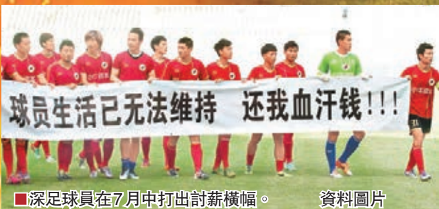
■深足球員在7月中打出討薪橫幅。

24日是深圳紅鑽足球俱樂部發放拖欠八名球員工資的最後期限,而俱樂部也終於在「大限」前完成「壓哨」救贖——深足球員向記者證實,向中國足協提出欠薪仲裁的八名球員已經在24日收到俱樂部今年8月以前欠條上的所有欠款。