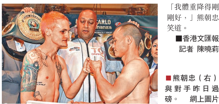
「我體重降得剛剛好,」熊朝忠笑道。

中國的前WBC世界草量級熊朝忠香港時間今日凌晨在蒙特卡洛的星際音樂廳,通過12回合比賽挑戰WBA和IBO的雙料冠軍巴德勒。這是中國拳手第一次打WBA和IBO這兩個組織的世界金腰帶戰。不過,在賽前一日的稱重儀式上由於體重超出30克,令他不得不在一面意大利國旗的遮擋下脫掉內褲赤裸過磅。