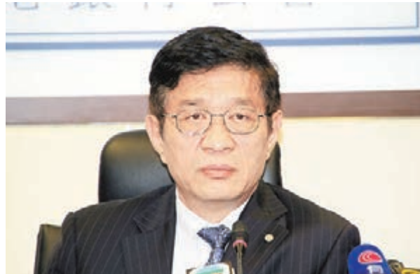
■香港銀行公會主席和廣北相信美國會如期在月底退市,結束買債計劃。

香港文匯報訊(記者 黃萃華)銀行公會主席和廣北昨會見記者時表示,以目前美國經濟狀況,預測明年美國下半年加息的機會較大。此外,他認為「佔中」行動對信用卡業務有負面影響。