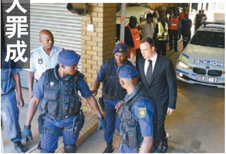
「刀鋒戰士」（右一）昨被判囚 5 年。