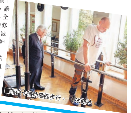
菲迪卡借助儀器步行。