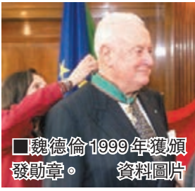
魏德倫 1999 年獲頒發勳章。 資料圖片

於 1972 年促成澳洲與新中國建交的澳洲前總理魏德倫，昨日凌晨逝世，享年 98 歲。魏德倫任內推動多項影響深遠的改革措施，包括承認土著土地權利、廢除「白澳政策」等，他也是首位訪華的澳洲總理，曾先後 11 次訪華，被尊為「澳中建交之父」。