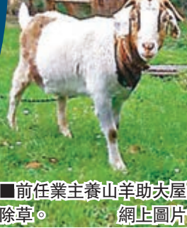
前任業主養山羊助夫屋除草。 網上圖片

澳洲墨爾本最近出現一個獨立屋筍盤，賣點並非房子本身，而是隨屋附送的山羊。事緣該幢房屋擁有大片草皮，整理麻煩，前任業主於是養了一隻山羊，讓她成為「活動除草機」，結果大受買家歡迎，最終房屋連山羊以 54 萬澳元(約 369 萬港元)成交。這幢房屋位於墨爾本郊區，佔地 4,453 平方米。地產經紀透露，房子原本標價 49.5 萬澳元(約 338 萬港元)，每當有人知道「買房送山羊」時都覺得很新奇。新業主表示，她和 3 名兒子得知新居還有一名新成員時都覺得很高興，因為可以節省整理草皮的時間，「比起搬進新家，我更期待和山羊見面。」 澳洲《先驅太陽報》