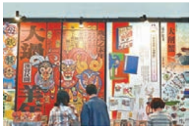
觀眾參觀台灣創意年畫。

兩岸文創創業加強交流 作為此次文博會的重要組成部分,第二屆兩岸文創產業對接會集中舉行了兩岸文創產業合作項目簽約活動。兩岸文創產業合作推進小組成員單位、台灣商業總會參訪團、貴州黔东南州文創代表團等300餘家兩岸文創機構負責人參加了此次對接會。 對接會現場,兩岸文創機構就首屆交流對接會以來,已經達成的兩岸文創產業合作實驗區建設、兩岸影視產業項目、兩岸文創品牌推廣平台建設等合作項目進行了簽約。自去年首屆兩岸文創產業交流對接