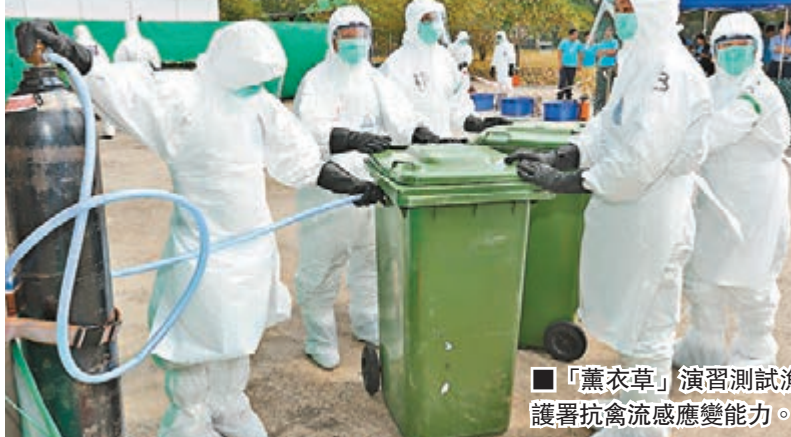
「薰衣草」演習測試漁護署抗禽流感應變能力。

香港文匯報訊（記者 聶曉輝）漁護署昨日舉行一項名為「薰衣草」的模擬演習，檢視本港一旦爆發高致病性禽流感時，該署須在本地農場進行家禽銷毀行動時的應變能力。是次演習提供模擬環境，讓參與與家禽銷毀行動的部門人員熟悉準備程序及行動中須執行的生物安全措施，並測試相關的應變計劃，以盡早找出需要改善的地方。演習主要檢視行動時整體的實地準備工作，以及各人員執行生物安全措施的情況，例如穿卸保護衣物的程序、正確消毒與處理家禽屍體的方法。漁護署設立了地區指揮中心和模擬農場，讓參與演習的人員模