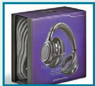
■Plantronics BackBeat PRO 包裝精美