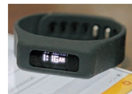
■Smart Dynamo 2，售價：HK$899。