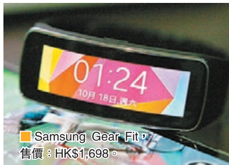
■Samsung Gear Fit，售價：HK$1,698。

Samsung Gear Fit 嶄新的弧形Super AMOLED輕觸式屏幕，以及可更換式錶帶，備有黑色、橙色、灰色、紅色、藍色、綠色選擇，即使在奮力運動時仍能讓你舒適配戴。它內置心跳感應器，給你即時監察健身情況，支持你按成效更改健身計劃，達到理想目標。