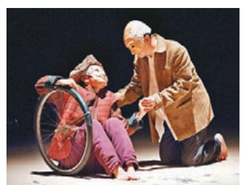
糊塗戲班11月再度公演《和媽媽中國漫遊》。

本地劇團糊塗戲班大受歡迎的戲劇《和媽媽中國漫遊》，將於11月第三度公演。該劇根據真人真事改編，敘述一生為兒子無私奉獻的母親，從沒離開過偏僻的村落。74歲的兒子感激行動不便的99歲母親為照顧自己操勞一生，決意帶她離開老家，看看外面多姿多彩的世界。這段感人的經歷經媒體報導後傳遍中國，兒子被譽為「本世紀最後的傳奇孝子」。