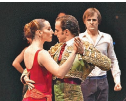
全球進一步認識西班牙舞蹈。

安東尼奧·加迪斯去世前數月，成立「安東尼奧·加迪斯基金會」，管理及推廣其作品，以藝術傳承為目標，推動