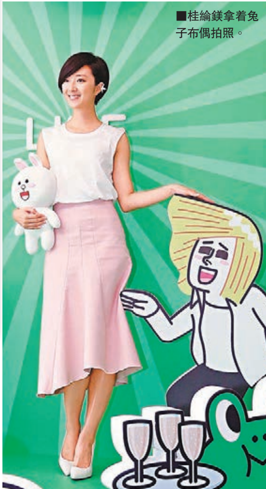
■桂綸鎂拿著兔子布偶拍照。