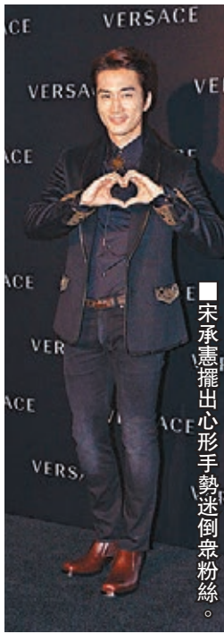
■宋承憲擺出心形手勢迷倒眾粉絲。