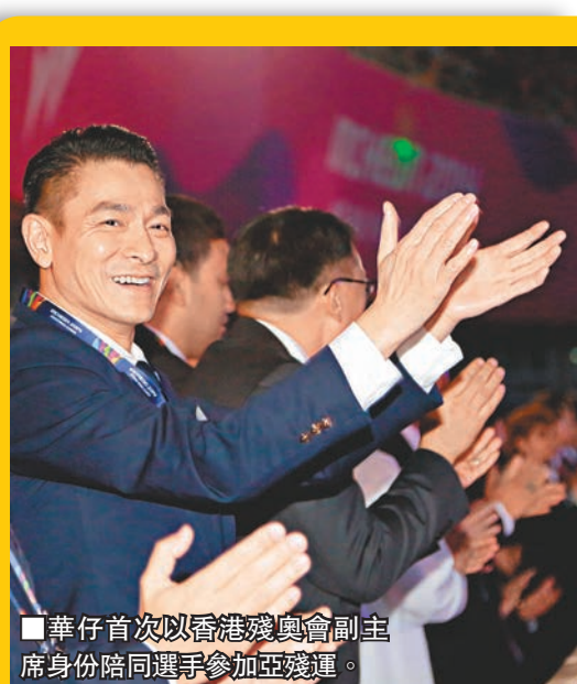
■華仔首次以香港殘奧會副主席身份陪同選手參加亞殘運。