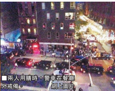
■兩人用膳時，警車在餐廳外戒備。