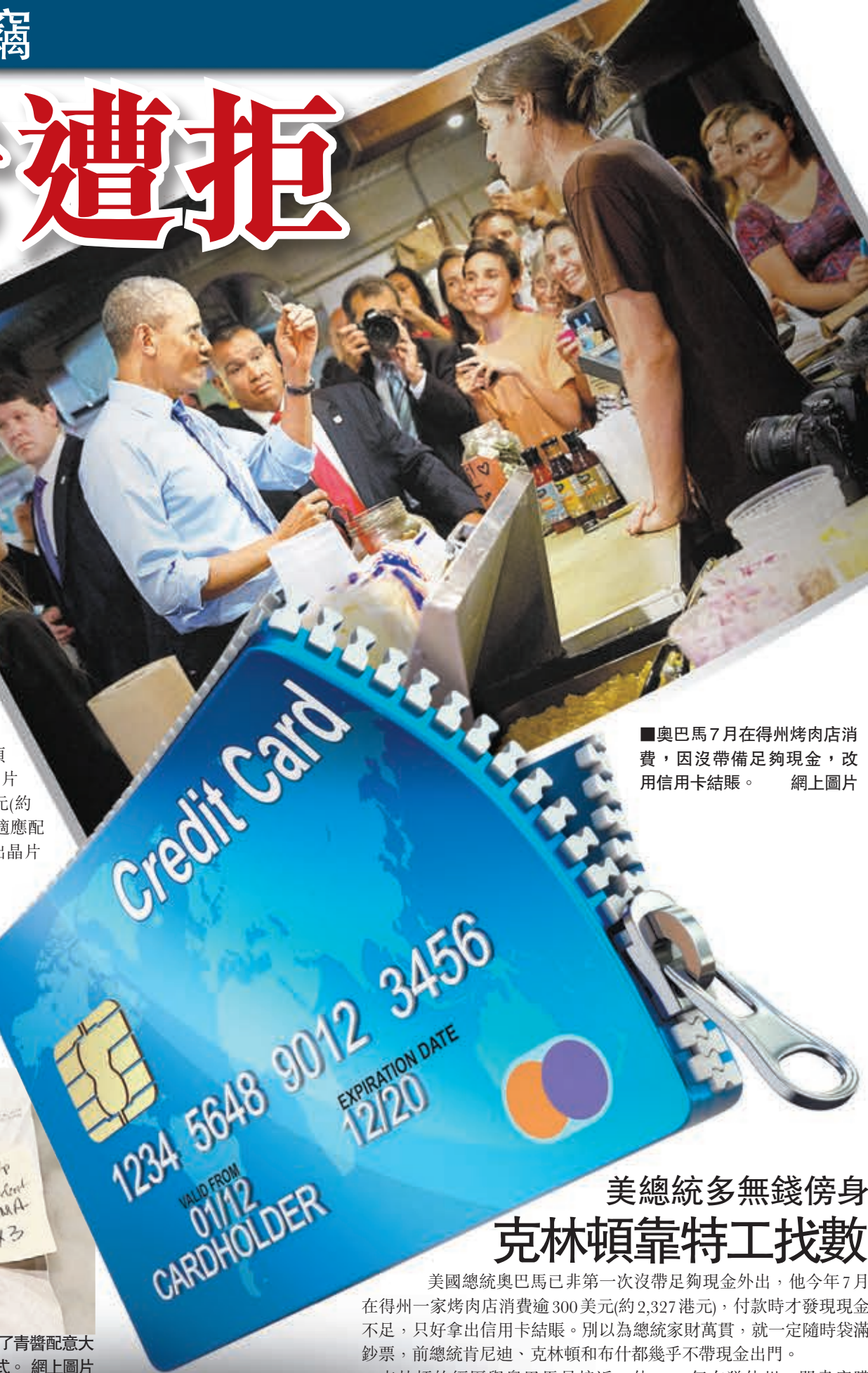
■奧巴馬7月在得州烤肉店消費，因沒帶備足夠現金，改用信用卡結賬。網上圖片