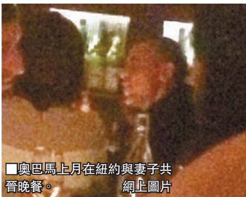
■奧巴馬上月與妻子米歇爾在紐約共晉晚餐。