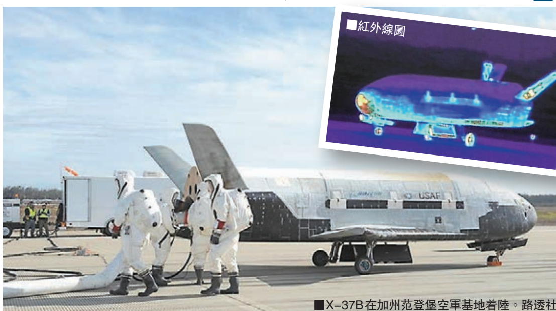
■X-37B在加州范登堡空軍基地著陸。路透社

英國廣播公司(BBC)曾引述《Spaceflight》雜誌編輯貝克指出，太空監視是大國競爭的新領域，認為X-37B可能用作監視中國太空實驗室。其他說法包括是於監視外國的太空衛星，甚至從高空監控別國境內。業餘太空愛好者在2011年發現，X-37B環繞地球的軌道飛經朝鮮、伊拉克、伊朗、巴基斯坦及阿富汗上空，令監視一說甚囂塵上。 ■美聯社/法新社/哥倫比亞廣播公司/英國廣播公司