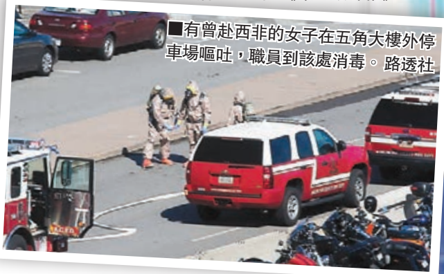
■有曾赴西非的女子在五角大樓外停車場嘔吐，職員到該處消毒。