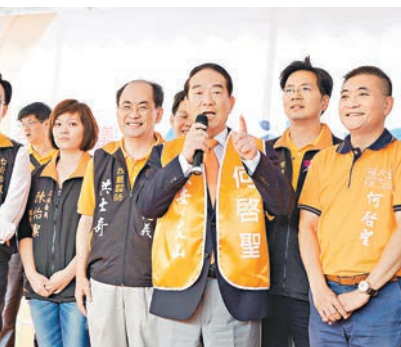
■宋楚瑜強調不捲入台北市長選戰。

宋楚瑜說，他近來頻上電視，當晚有多家媒體要播他的專訪，他七老八十，聲音夠大吧。台北市選民對好的人選，不要怕票多，應該對他們投下信任票，對不做事的人投下不信任票。外界關切宋是否會幫市長參選人