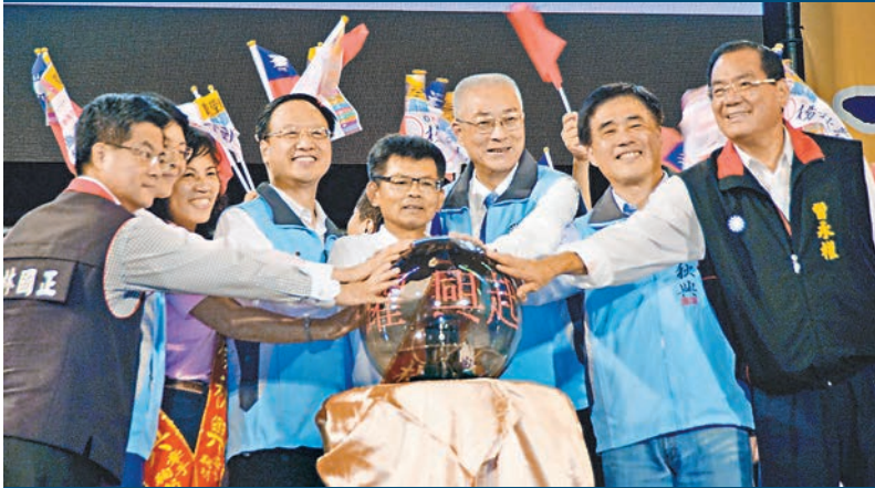
▲楊秋興(右四)競選總部昨日成立，府院高層南下站台。