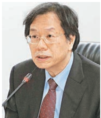
■「衛生福利部長」蔣丙煌。