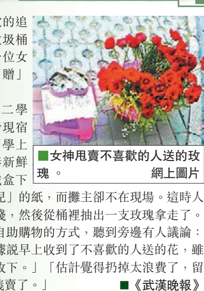
■女神甩賣不喜歡的人送的玫瑰。網上圖片