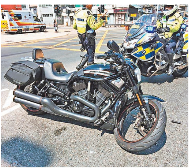
涉車禍的哈利電單車前輪盡毀。

香港文匯報訊(記者 杜法祖)一名「哈利」電單車愛好者，昨商借友人電單車遊車河，豈料途經土瓜灣馬頭涌消防局對開燈位時遇意外，遭尾隨私家車撞撞致逆線衝撞一輛小巴才