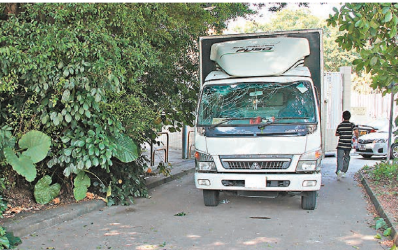
大埔水圍村塌樹壓中途貨車。

香港文匯報訊(記者 鄧偉明)大埔發生塌樹傷人意外，一輛密斗貨車昨駛經大埔頭水圍村小路時，突被路旁一枝斷落的10呎長大樹樹樑擊毀車頭擋風玻璃，司機當場被碎片割傷手部，更因急剎車致扭傷頸部，由消防員救出送院。