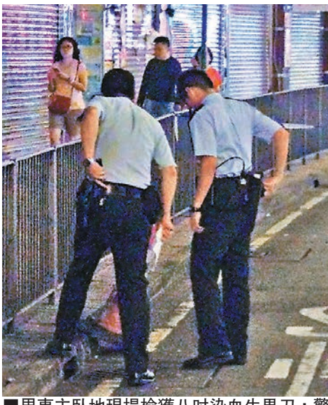
男事主臥地現場檢獲八吋染血生果刀，警員用「雪糕筒」遮蓋。