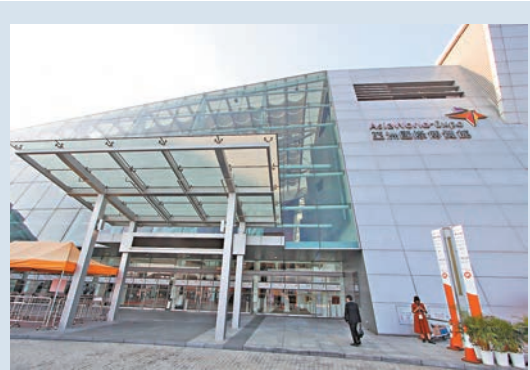
亞洲博覽館內展覽會首日即發生3宗竊案。