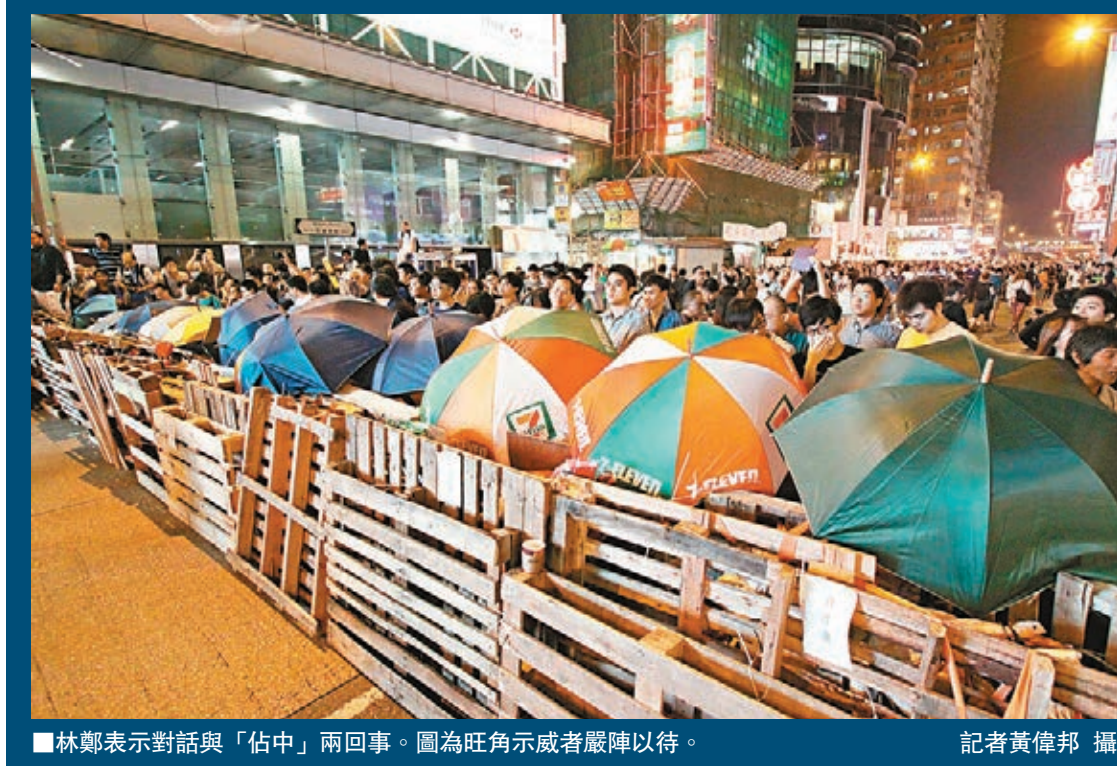
林鄭表示對話與「佔中」兩回事。圖為旺角示威者嚴陣以待。