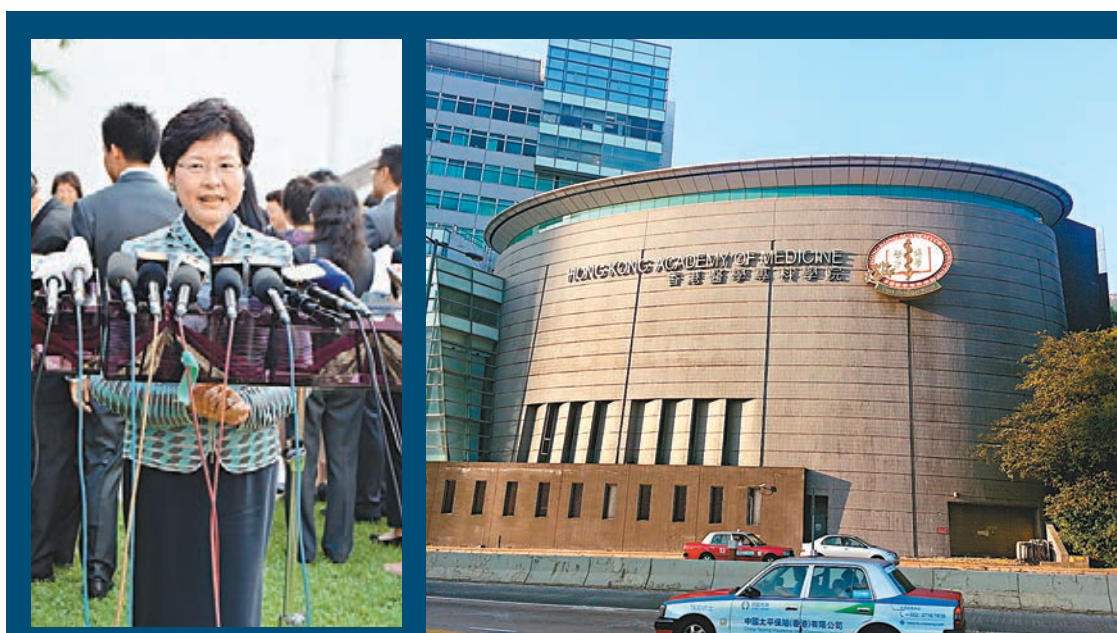
林鄭月娥表示,特區政府與學聯對話的進展「非常良好」。