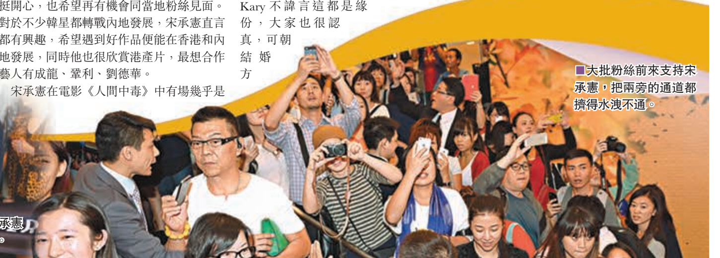
大批粉絲前來支持宋承憲,把兩旁的通道都擠得水洩不通。