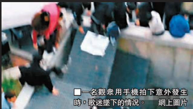
■一名觀眾用手機拍下意外發生時，歌迷墜下的情況。網上圖片