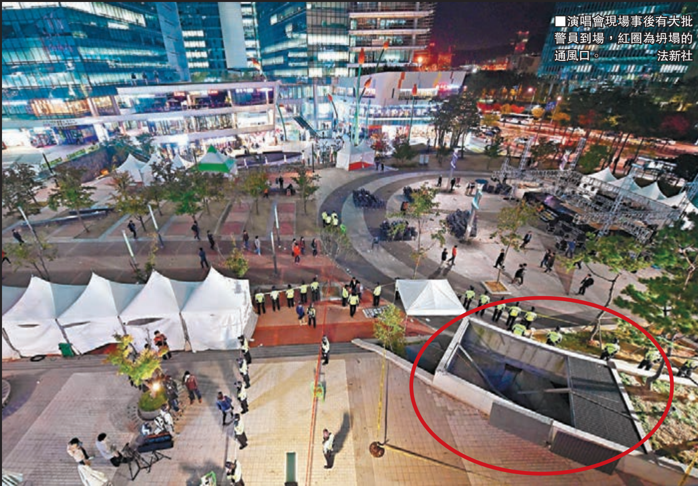
■演唱會現場事後有天批警員到場，紅圈為坍塌的通風口。