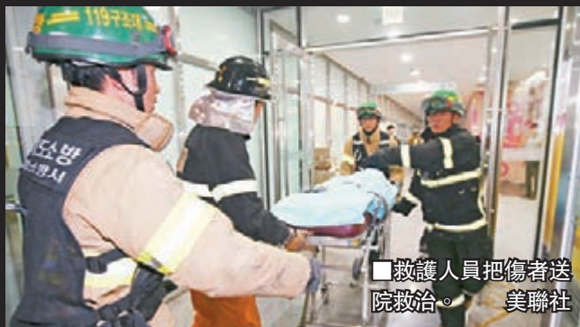
■救護人員把傷者送院救治。