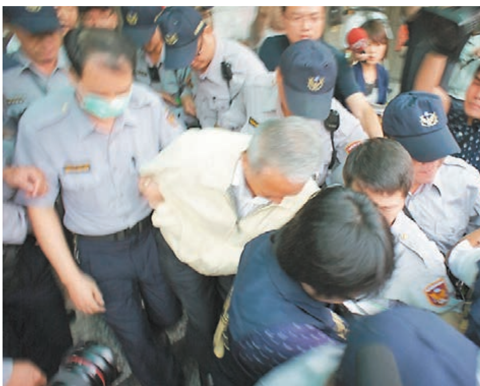
■頂新前董事長魏應充(白色外套者)被送往看守所。

香港文匯報訊 據中央社報道,中國國民黨發言人陳以信昨日說,從2008年到2013年,國民黨未曾收受頂新集團政治獻金。有綠營人士在親綠媒體《美麗島電子報》撰文指稱,頂新魏家於2012年大選前,捐助馬英九陣營高額政治獻金,「一次出手就是逾10億的政治獻金」。國民黨晚間透過新聞稿駁斥,並鄭重要求撰文者不可含血噴人、惡意扭曲。