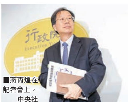
■蔣丙煌在記者會上。

發言人表示,近來食品安全案件頻傳,社會大眾對當局整頓食安的期待甚為殷切,因此「衛福部」更需要一位熟悉食品相關問題的領導人,「行政院長」江宜樺決定請蔣丙煌出任「衛福部」部長,係着眼於非常時期必須有非常做法,擺脫過去「衛福部」部長一定要由醫療或公衛背景