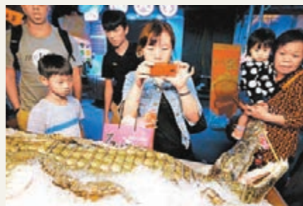
■台民眾對夜市出現鱷魚大感好奇。

報道稱,大陸頒布了俗稱「禁奢令」的中央八項規定,打擊大陸官員的一切貪腐行為。一下子,世界各地拚命捕撈、養殖、生產送往大陸的高價品,一夕都變成當地官員、企業老闆避之唯恐不及的洪水猛獸,導致鮑魚、鱷魚這些豪門食材從高檔餐廳丟到路邊攤。