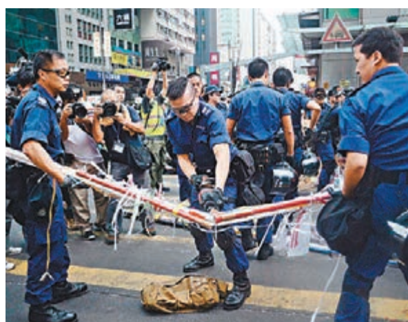
有警員昨晨用工具清除旺角的障礙物。