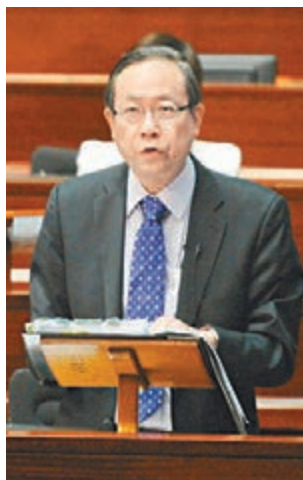
黎棟國表示警員克盡己任卻遭肆意辱罵,受盡委屈。

香港文匯報訊(記者 鄭治祖)立法會昨日結束3日的休會辯論,否決由公民黨議員梁家傑提出有關政府及警方處理「佔中」集會手法的議案。保安局局長黎棟國在總結時引述前線警員及其家屬的感受,表示警員日以繼夜克盡己任卻遭肆意辱罵,受盡委屈,家屬亦為前線警員的安危和所受挑釁,感到萬分徬徨和難受,說明反對派議員對警隊連日的批評毫不公道,不近人情。黎棟國呼籲各界理解警察維護法治的角色,促請「佔中」者以合法和平手段表達意見,盡快平息事件。