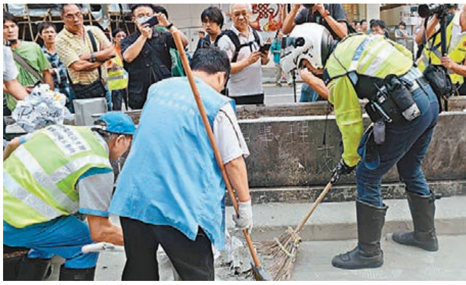
警方昨晨在旺角清除障礙物,有交警更擔任起清道夫的角色。

立法會本周三傍晚開始就梁家傑提出的「自本年9月26日起特區政府及香港警察處理市民集會的手法」議案進行休會辯論。經過約18個小時的辯論後,議案昨日最終未獲兩部分在席議員分別過半數贊成而被否決。