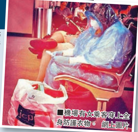
■機場有女乘客穿上全身防護衣物。

世界糧食計劃署計劃運送食物予利比里亞、塞拉利昂及幾內亞共130萬人，但至今僅約53.4萬人受惠，仍有76.6萬人捱餓。