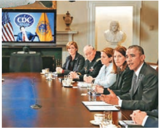
■奧巴馬與CDC高層舉行視像會議。