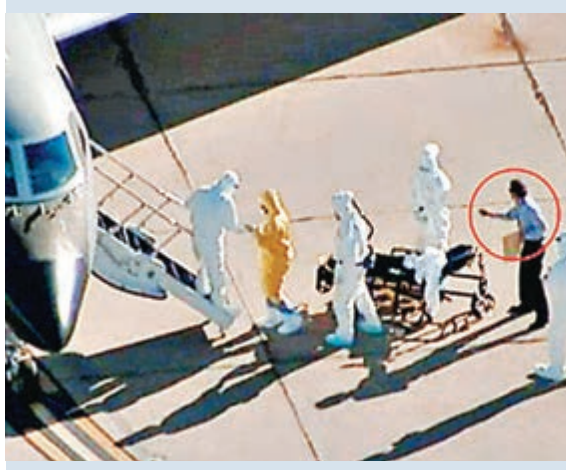
■文森乘坐醫療專機前，有一名並無穿保護衣的職員接近。