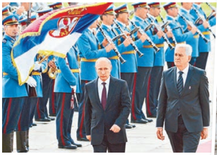
■普京抵達塞爾維亞，獲該國官員迎接。

普京昨晚轉到意大利參加亞歐會議(ASEM)，並將與烏總統波羅申科及德國總理默克爾舉行會談，商討烏危機。