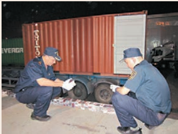
海關人員檢出大批走私手機。 本報深圳傳真

皇崗海關提醒廣大進出口企業及司機,採取車體設置暗格藏匿、人身綁藏等逃避海關監管的手段,搗運應稅物品、國家禁止或限制進出境物品均屬於走私行為,海關將依法嚴厲查處。根據海關有關規定,專門用於走私的運輸工具,或2年內3次以上用於走私的運輸工具,將予以沒收;對於使用特製設備、夾層、暗格實施走私的,海關將予以從重處罰。