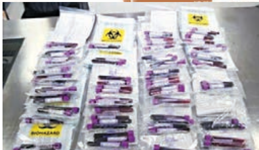
內地赴港鑒定胎兒性別形成黑色產業鏈。圖為此前被檢獲的內地孕婦血液樣本。

今年下半年以來,羅湖海關已截獲旅客違規攜帶「孕婦血樣」共計112管。海關人員提醒廣大市民,攜帶和郵寄、快遞人體血液和血液製品進出境,海關將憑衛生部的批件或證書辦理驗放手續。旅客不能提供批准文件或證書的,海關將有關人體血液及其製品扣留,並及時移交或通知口岸衛生檢疫機關處理。