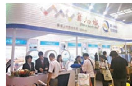
華南城在博覽會上的展位。

而作為內地快遞巨頭港企順豐,其發展人士告訴記者,公司利用其全國巨大網絡優勢,兩年前推出電商平台順豐優選,現在物博會上又推出順豐嘿客,包括紅酒、母嬰用品、糧油等眾多商品的購買優惠。該公司還以其全國2800家門店的優勢,客戶在指定網點寄快遞可以優惠2元,目前公司自有10多架貨運班機和10多架租賃貨運飛機,共計30多架,除了服務客戶外,也為公司電商商品銷售提供了便捷的服務,公司還在北京設倉儲中心,以更好地服務北方客戶。