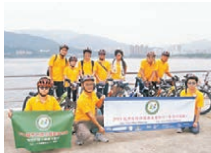
香港佛教菩提青年團團友騎行倡環保。

香港文匯報訊(記者 何花 東莞報道)廣東觀音山國家森林公園近日舉辦了「城市環境與健康萬里行」活動,20餘名自行車騎行愛好者從北京南下,騎程8000公里到達東莞,途經108座城市倡導環保出行,減少污染。香港佛教菩提青年團30餘名團友參與了該活動香港站部分騎行及自行車山地賽活動。該團將於12月在香港再次舉辦騎行宣傳活動。「團友騎行過程雖有受『佔中』阻礙道路