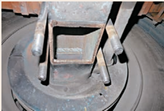
暗格設在該貨櫃車後部大樑部位,非常隱蔽。