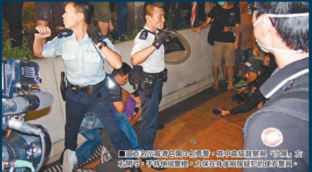
逾百名示威者包圍3名勇警,其中高級督察與「沙展」左右開弓,手持伸縮警棍,力保在身後制服疑犯的便衣警員。

香港文匯報訊(記者 文森、杜法祖)金鐘龍和道昨日凌晨繼續有示威者曾兩度堵塞馬路,與警察推撞,其中一次更因約百名示威者不滿一名男子被警方帶走而群起包圍3名警員,警方須施放胡椒噴霧驅散示威者。警方最終拘捕2名男子,其中一人涉嫌襲警,另一人涉嫌在公眾地方擾亂秩序。警方昨日批評示威者以「打游擊方式」堵塞道路,目的是令警員疲於奔命,行為極之缺德,非法及浪費警力,不排除稍後會有拘捕行動。