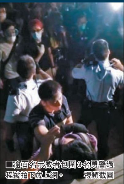
逾百名示威者包圍3名勇警過程被拍下放上網。