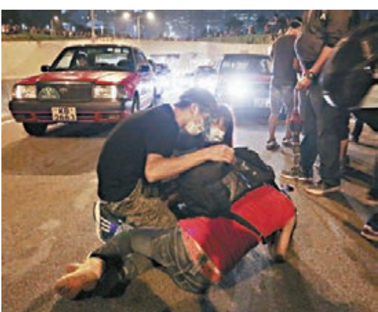
假裝「跌錢」行動展開,示威者三五成群「腳」阻路。

警察公共關係科警司江敏強昨日下午在例行記者會上指出,昨日凌晨約11時10分,有警員目睹1名男子在龍和道近添馬公園中央分隔線上,將1個水樽踢到龍和道馬路,擊中1輛行駛中的私家車,警方遂以涉嫌「在公眾地方擾亂公共秩序」拘捕該名男子,惟當時有大批示威者起哄叫罵及指罵警員,警方最終再拘捕1名24歲涉嫌襲警的男子。他並批評,有示威者在網上號召以「打游擊方式」堵塞道路,令警員疲於奔命,亦有人在馬路上以「執毫子」為由,佔據道路致其阻塞,批評有關人士目的只是造成交通混亂,行為極之缺德,非法及浪費警力,並強調任何人在網上號召作非法行為,均要負上刑事責任。警方會繼續搜證,不排除稍後會有拘捕行動。 江敏強表示,旺角多條主要道路已被「佔領」人士堵塞逾2個星期,已激起當區居民和商戶不滿,發生衝突的機會大幅增加。示威者前晚在旺角企圖搭起幾米高的巨型棚架,明顯是置當區居民的生活及安全不顧。他呼籲示威者盡快拆除路面障礙物,不要阻礙警方行動和衝擊警方。