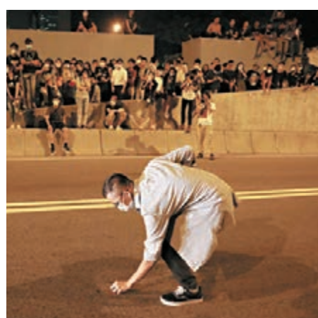
示威者假裝跌錢,俯身執起,蓄意阻礙交通。