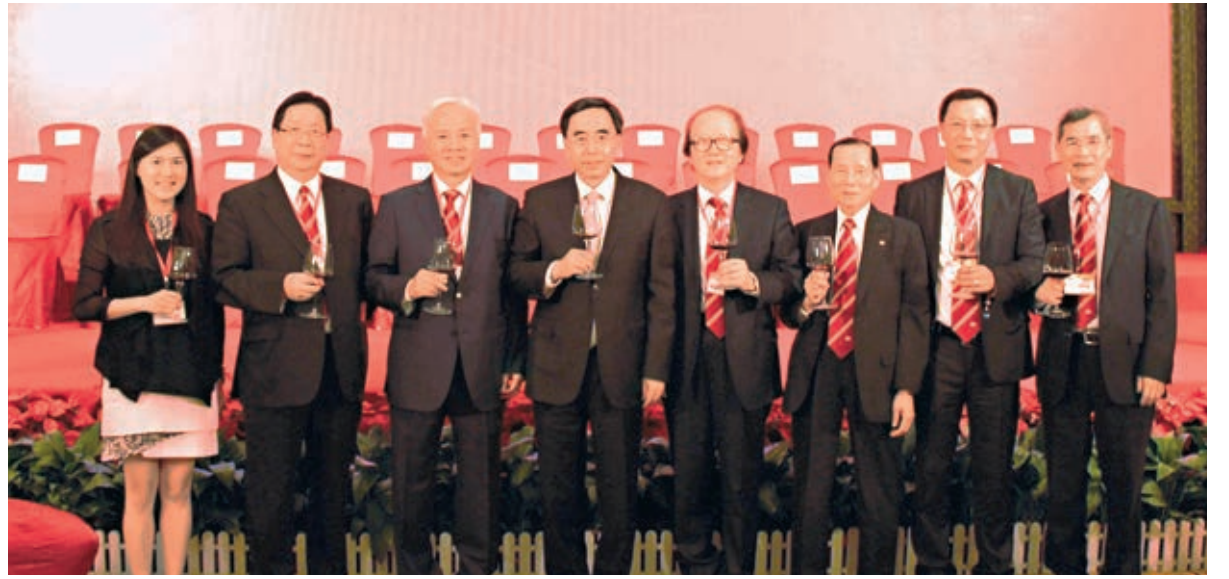
朱小丹省長(左四)希望中總繼續積極推動粵港合作。

說國家計劃到「十二五」規劃期末，即2015年底，實現內地與港澳服務貿易自由化。這將進一步深化CEPA，更好發揮港澳服務業的優勢。商務部及有關部委正在評估推進的現狀，處理法例規章事宜，並加強與港澳工商界的溝通交流。