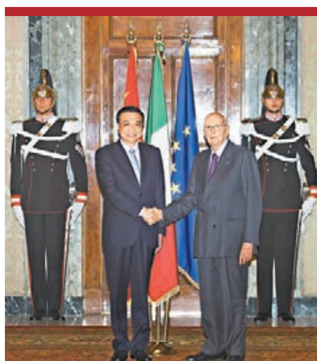
■李克強會見意大利總統納波利塔諾。

當天下午，李克強還與納波利塔諾總統舉行了會面。此外，當地時間15日，李克強與格羅索參議長和博爾德里尼眾議長分別會面，並出席中意創新周大會等活動。