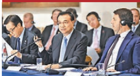
■李克強與倫齊共同會見中意企業家委員會委員及企業家代表。中新社