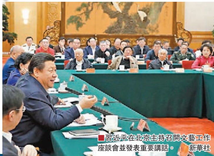
■習近平在北京主持召開文藝工作座談會並發表重要講話。