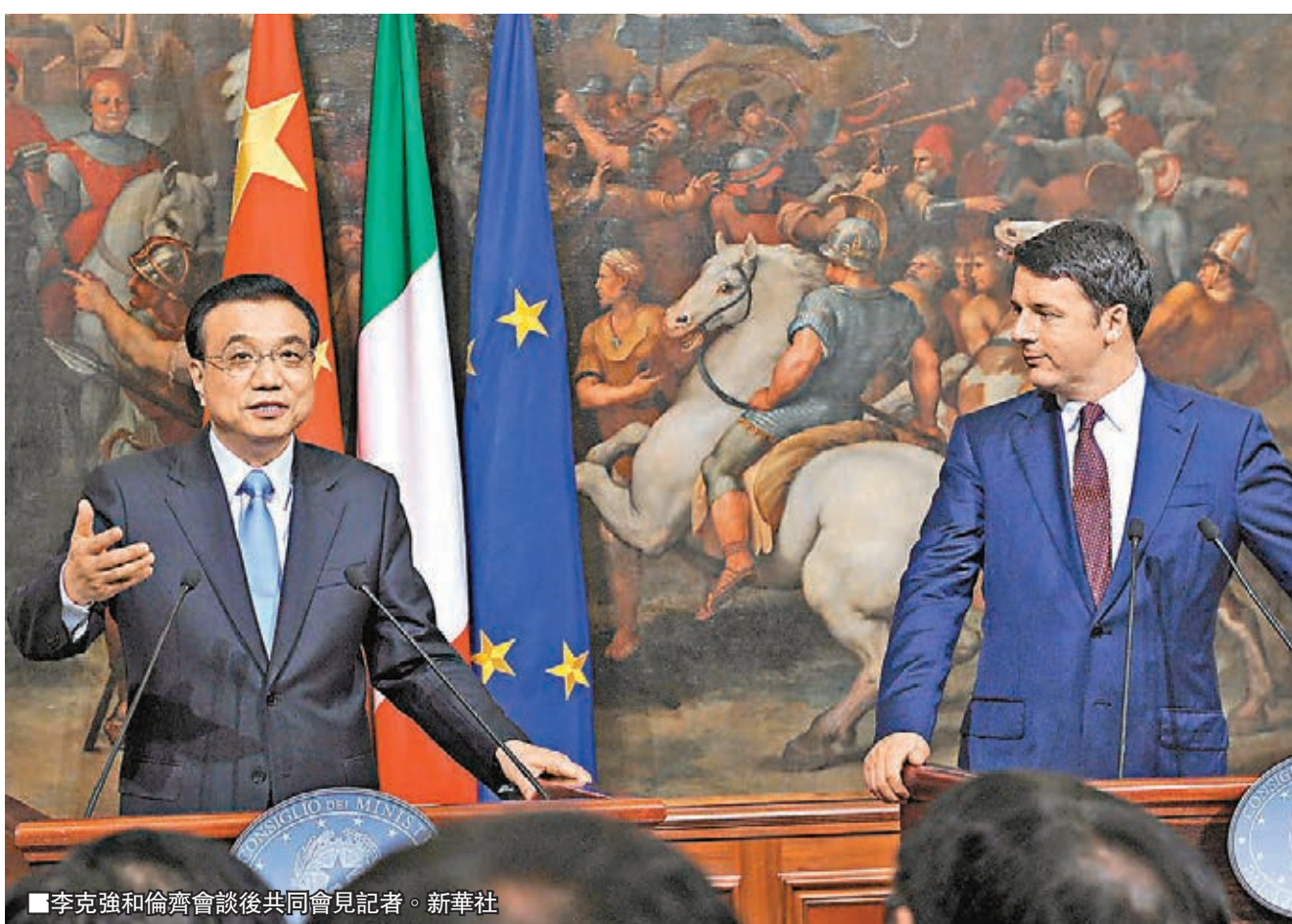
■李克強和倫齊會談後共同會見記者。