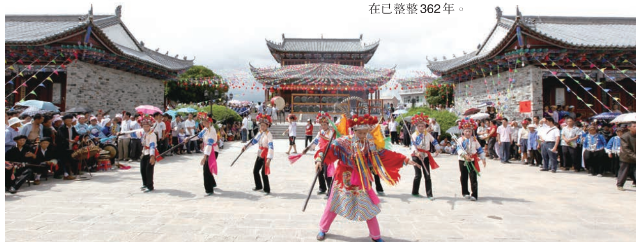
皇姑廟前的沙戲表演。

明末永曆帝一行逃難至雲南，將抱病的胞妹安化郡主安置在廣南城郊分水嶺附近寨子的壯族農戶家。永曆帝走後，難舍骨肉情的安化郡主日夜思念皇兄，直至心力交瘁，病體難支，最終病逝於馬蹄井，香消玉殞，正在出逃路上疲於奔命的永曆帝對此卻一無所知。壯族民眾念及與皇姑相處的舊情，將皇姑遺體移至火燒寨安葬，以條石壘砌墳墓，書寫碑文「明桂恭王之妹安化郡主之墓」。火燒寨原本飽受火災之苦，自從安葬皇姑後，從此再無火災，變成了太平寨。村民們感念皇姑的庇佑，便在皇姑墳前建廟祭祀，至今香火不斷，每年皇姑忌日，鄉民們自發興起接皇姑的習俗，沿襲到現在已整整362年。