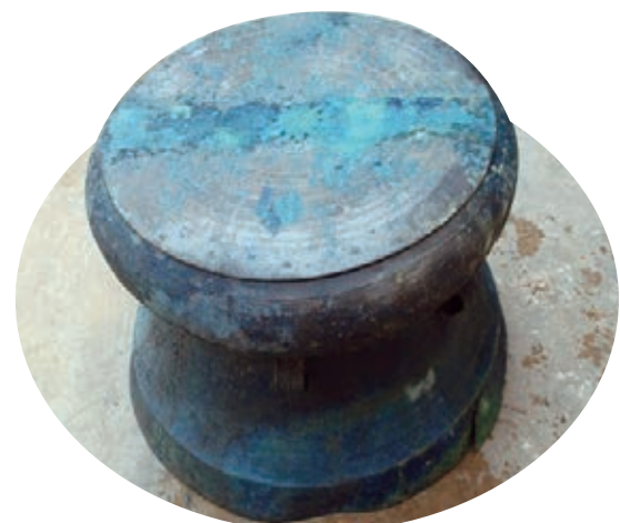
目前存世的最大的石寨山型銅鼓。

1919年，在廣南一個普通的小山村，發現了一面精美的銅鼓，由於出土的地方叫做阿章村，銅鼓就命名為「阿章鼓」，以其精美的鑄造工藝和複雜的紋飾，被學界公認為雲南出土銅鼓中最精美的一件，為雲南省博物館「鎮館之寶」。2011年在離阿章村7公里的牡宜村，出土了迄今世界上最大的石寨山型銅鼓。