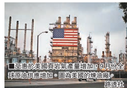
受惠於美國頁岩氣產量增加，9月份全球原油供應增加。圖為美國的煉油廠。

受供應增加及需求增長放緩影響，加上石油輸出國組織(OPEC)似乎無意減產，國際油價持續受壓。11月份布蘭特期油昨日下午交易時段跌71美仙，至每桶87.59美元，是2010年中以來最低；美國11月份付運的西得州中質原油亦跌96美仙，至84.78美元的2年低位。分析認為，除非環球局勢突變，推動需求增加，否則油價料繼續下滑。