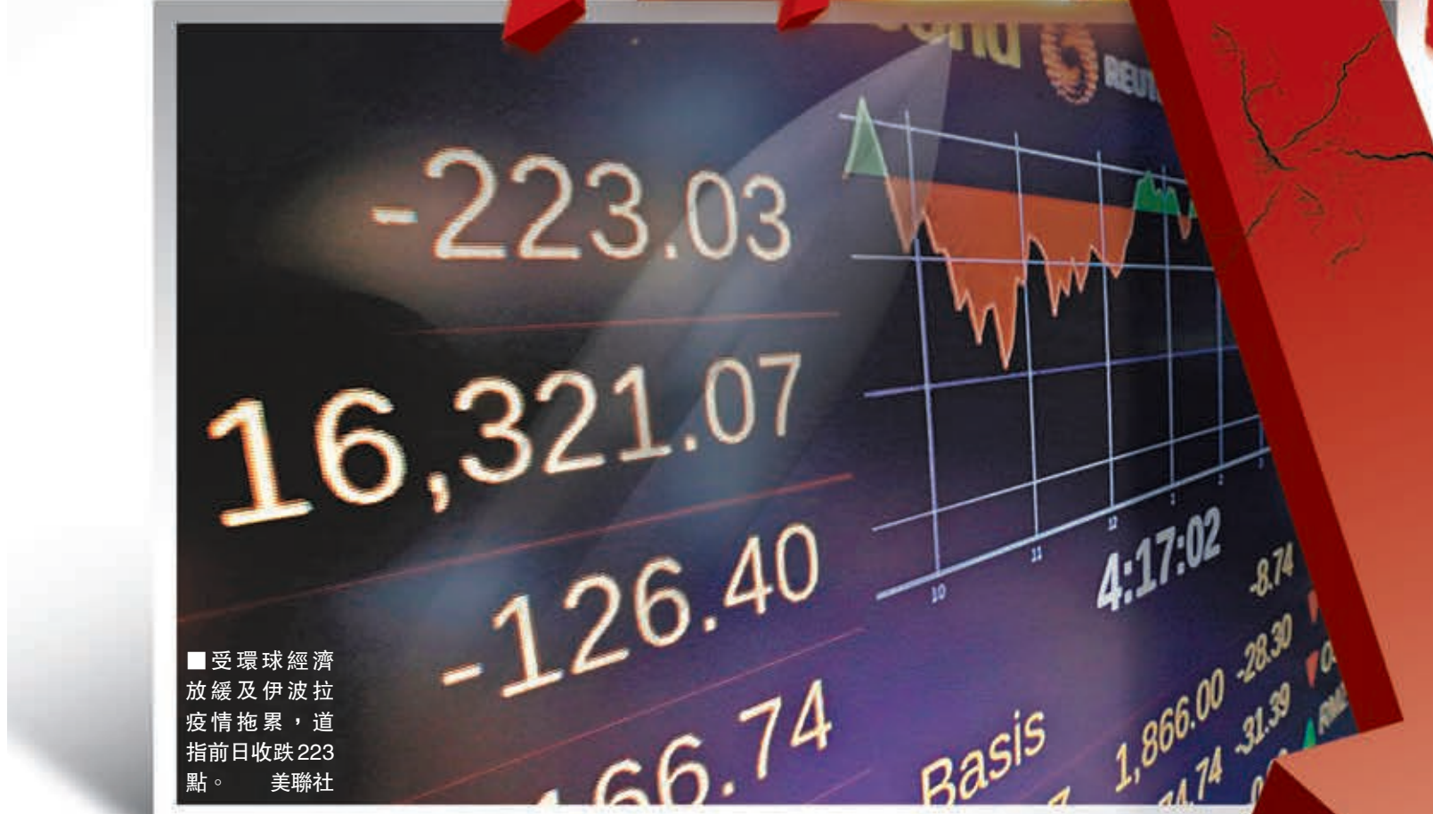
受環球經濟放緩及伊波拉疫情拖累，道指前日收跌223點。