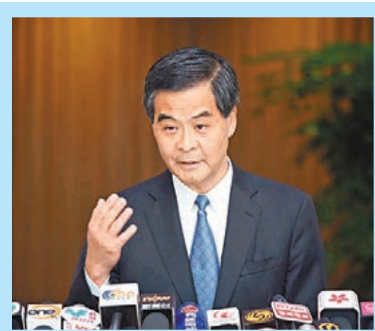
陳佐洱讚揚梁振英是敢於承擔的人。

深圳綜合開發研究院經濟社會研究中心主任張玉閣表示，香港應是一個經濟城市，如果經濟前提不再作為發展共識，對香港來說絕對是一種破壞。他認為，「佔中」無疑造成香港社會內部與內地之間的撕裂，對香港的影響將非常大。