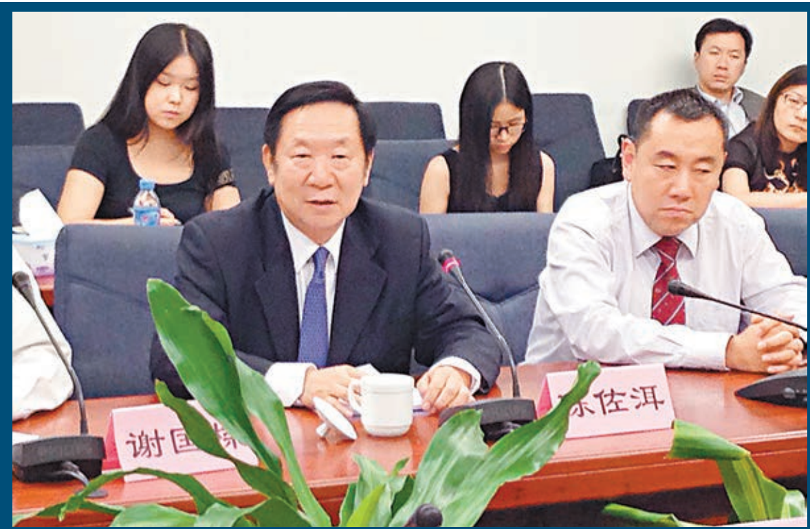
陳佐洱指出，「佔中」正是美國策動的港版顏色革命，隱藏巨大陰謀。

他表示，中央對香港實施「一國兩制」、「港人治港」、高度自治的方針，是一項成功的基本國策，絕不因「佔中」而發生改變。這像江水向東流，在過程中，可能會遇到險灘、礁石等障礙，但是江水不會轉向，都會匯入浩浩蕩蕩的大海。這是中國的基本地勢決定的。中國的地勢是西高東低，從西向東慢慢流入大海