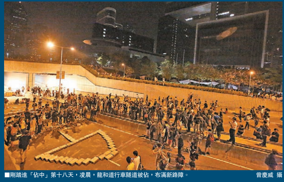
剛踏進「佔中」第十八天，凌晨，龍和道行車隧道被佔，佈滿新路障。