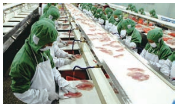
■ 鴻浩水產有限公司的羅非魚系列產品遠銷美國、加拿大、俄羅斯等地。

「雲南從這裡走向大海」，當連接雲桂的廣昆高速駛近右江上游建設中的富寧港，沿岸幾個大字纏繞來繁忙的車流彰顯著這裡獨一無二的區位優勢。富寧是雲南離香港最近的城市，也是雲南省唯一既沿邊又緊鄰沿海經濟發達地區的城市。追溯歷史，富寧曾經因為珠江水運昌盛數百年，在滇、桂、粵、湘等幾個省份享有「小香港」的美譽。事實上，作為雲南省的東大門，富寧縣不僅沿邊、沿江、沿高速公路，而且還是雲南通往沿海發達地區廣西、廣東的重要門戶，兼享泛珠「9+2」合作區域與中國—東盟自由貿易區交叉點、結合部的優勢。大通道的建設創造了卓越的