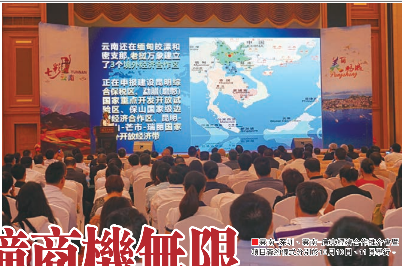
■ 雲南—深圳、雲南—廣東經濟合作推介會暨項目簽約儀式分別於10月10日、11日舉行。