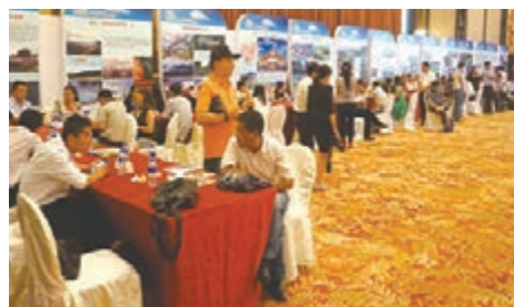
■ 雲南州市推介展台。

業爭相入駐。滇中產業新區與TCL集團簽署合作框架，項目擬選址楊林經開區，長水國際機場北側。廣藥集團與中國通用投資、北京同仁堂共同投資38億元在滇中產業新區建設中國中醫養生養老健康產業城。比亞迪欲向滇推廣新能源客車。雲南省金融辦與香港交易結算有限公司、畢馬威企業簽署戰略合作協議，推薦優秀滇企上市。