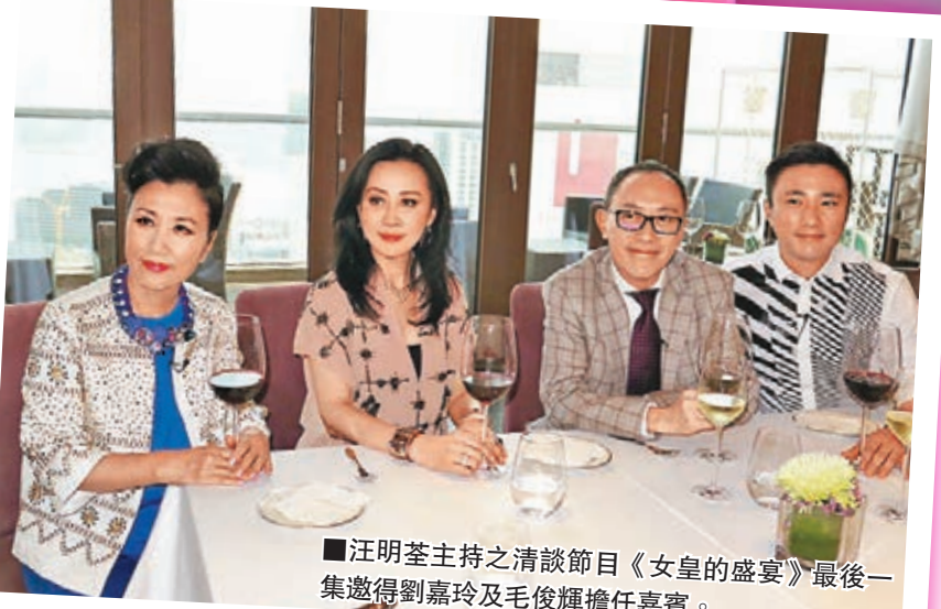
■汪明荃主持之清談節目《女皇的盛宴》最後一集邀得劉嘉玲及毛俊輝擔任嘉賓。

紅姑透露攝影展在本周四便結束，連日來很多朋友到來參觀欣賞，像嘉玲這般有心，她都會在場以示答謝。會否幫嘉玲拍一輯靚相？紅姑笑說：「嘉玲敢讓我影，我就幫她影啦。」嘉玲即笑說：「那等我們商量一下拍甚麼主題，不過這次透過她的鏡頭下，才知道香港十八區有這麼多美景。」嘉玲表示自己不懂攝影，要拍好看應先拿「傻瓜機」來好好練習一下。嘉玲知紅姑喜歡攝影，即鼓勵她嘗試做導演，可以先拍微电影來實驗一下，她也願意當女主角。紅姑帶笑表示自己比較害羞，對景物才會自在，對人則不太敢去溝通，嘉玲笑說：「我都不善於溝通，只是夠膽罷了。」提到紅姑喜愛行山運動，嘉玲原來都有行山習慣，但每次最多行兩個小時，不似周潤發般高級組行四至六小時。