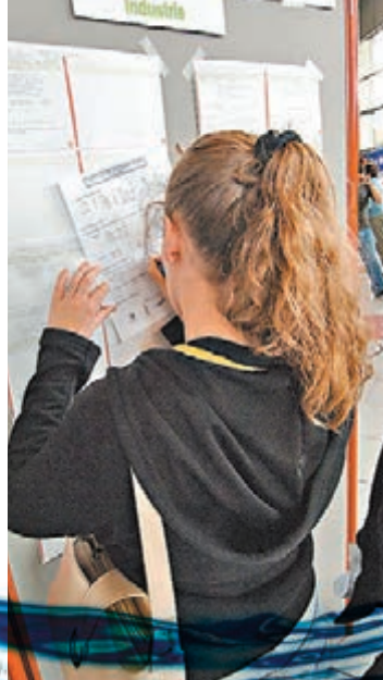
失業人士填寫求職表格。