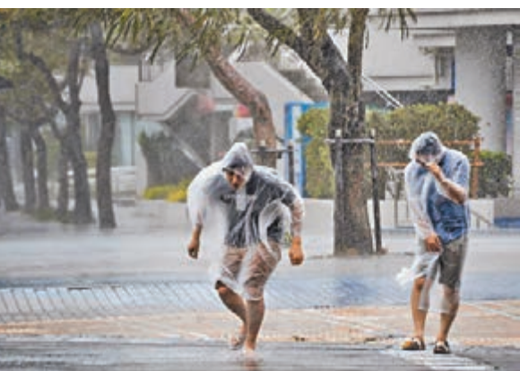
■ 市民遭「黃蜂」吹至走路也有困難。