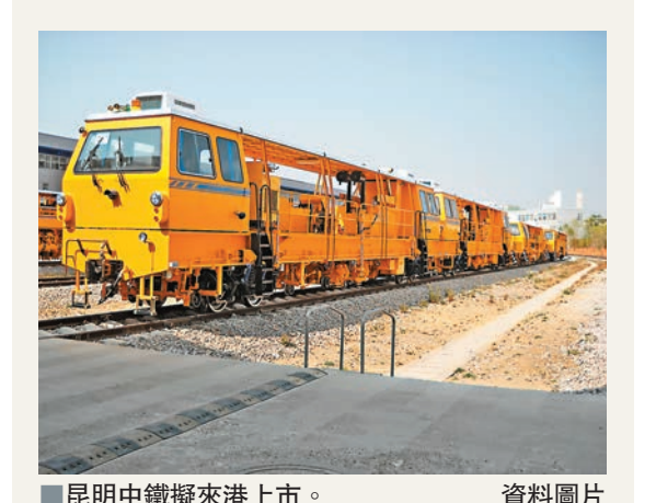
昆明中鐵擬來港上市。

(IMF)會議時對記者表示，中國政府認為包括房地產市場在內的當前經濟狀況「仍然穩定」。朱光耀稱，儘管內地樓市價格出現一定的下滑，這並非出現問題，只是因為之前的房價過高，應該允許市場力量發揮作用。他表示，政府過去曾努力控制房地產市場，「但並不是很奏效」。我們密切關注，但是要讓市場來發揮作用。我們有足夠多的宏觀經濟管理工具，但目前在採取任何重大刺激計劃方面仍非常謹慎。」朱光耀指，「這不僅是指房地產市場，整體經濟亦不需要重大刺激計劃，必須讓市場發揮作用。」問及對中資銀行可能受房地產市場下滑衝擊是否感到憂慮時，朱光耀表示，對銀行領域有「認真的監控」，銀行方面亦有「大規模資本緩衝」，並指銀行業不良貸款率僅為1%左右。