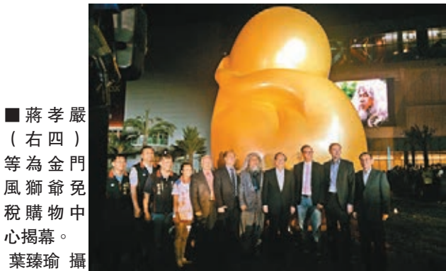
蔣孝嚴(右四)等為金門風獅爺免稅購物中心揭幕。

香港文匯報訊(記者 陳麗芳、葉臻瑜 金門報道)為慶祝2014第五屆世界金門日暨金門建縣100年，計劃在年底開幕的金門風獅爺免稅購物中心，日前舉辦預熱演唱會及廣場雕塑揭幕儀式，為金門「慶生」。國民黨榮譽副主席蔣孝嚴