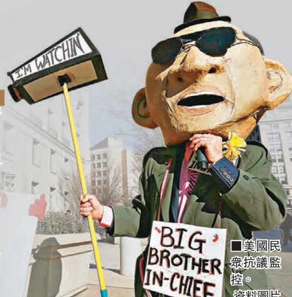
美國民眾抗議監控。資料圖片