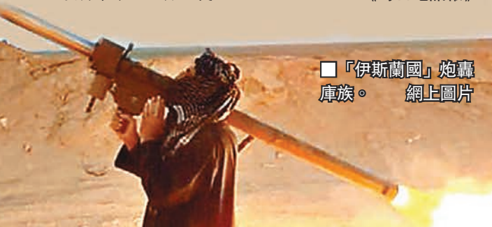
「伊斯蘭國」炮轟庫庫。

恐怖分子回流 倫敦監視數千人 英國倫敦市長約翰遜接受媒體訪問時表示，情報部門正監視數千名在倫敦的懷疑恐怖分子，當中約500名聖戰分子曾前往敘利亞及伊拉克，參與極端組織「伊拉克和黎凡特伊斯蘭國」(ISIL)的聖戰，但來自本土恐怖分子的威脅更嚴重。 英國政府相信，赴敘利亞及伊拉克加入ISIL和「基地」組織的英人已回國，他們是對英國的主要威脅。約翰遜透露，自英國提高恐襲威脅級別後，情報部門每日參與數千項行動。目前有數千人受到監視，反映本土恐怖分子發動恐襲的威脅，遠超相對少數曾赴海外作戰的極端分子。 約翰遜指出，加入ISIL的英人中，約1/3或一半可能來自倫敦，若他們回國，當局將認真處理。 約翰遜正宣傳其講述已故首相邱吉爾的著作《The Churchill Factor》，他談及空襲伊拉克及反恐時，認為若邱吉爾仍健在，也會認同空襲伊拉克的決定，亦會強硬打擊本土恐怖主義。 ■《每日電訊報》