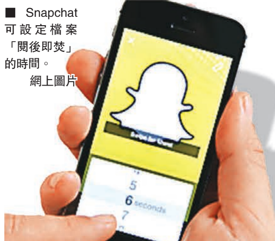
Snapchat可設定檔案「關後即焚」的時間。網上圖片

第三方apps出事 Snapchat允許用戶傳送及接收照片和短片，約50%用戶是13至17歲青少年。用戶可設定檔案「關後即焚」的時間，若對方把訊息複製至手機，傳送者會獲告知。然而，部分連接Snapchat的第三方apps容許在傳送者不知情下，把檔案儲存到手機。黑客看準這問題，於是入侵Snap Save等apps竊取照片和短片，繼而在周四晚上載至網上討論區4chan。有用戶聲稱，部分受害者來自挪威、丹麥、英國和美國。由於不少照片可能屬於未成年人士，恐涉及兒童色情。Snapchat前日發聲明，指伺服器沒被入侵，公司並非檔案外洩的源頭，是用戶使用第三方apps來傳送和接收檔案，因而遭入侵，而公司已明確地禁止這種做法。 ■《紐約時報》/法新社/《泰晤士報》/英國廣播公司