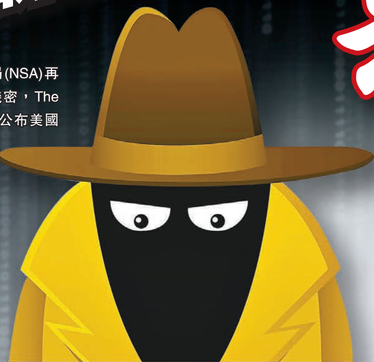
國安局被揭發透過「鷹哨」行動，利用不同手段盜取網絡情報。

美國國家安全局(NSA)再被揭發竊取外國機密，The Intercept網站昨日公布美國中情局(CIA)前職員斯諾登的密件，披露國安局於2004至2012年推行「鷹哨」(sentry eagle)行動，在中國、韓國和德國企業安插間諜竊取敏感資料。